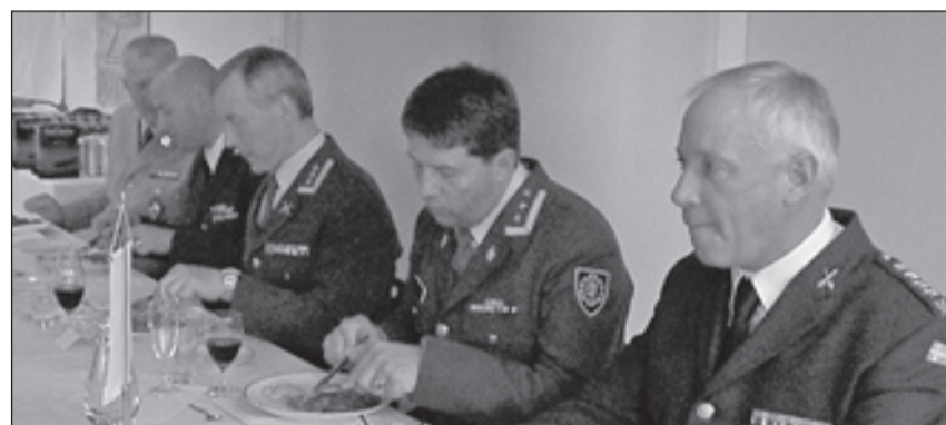
Piirien puheenjohtajat ja everstit.