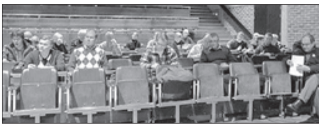
SAR- peruskurssi ja mekaanikot, Rovaniemi.

01.09.-30.11. Rovastikunnan turvakurssi, Kemi-Tornio 01.09.-30.11. Kehitysvammaisten turvakurssi, Muonio 01.09.-30.11. Maahanmuuttajan turvakurssi, Rovaniemi 16.09.-16.09. MAAKK:n kuntotesti, Rovaniemi 16.09.-16.09. Kurssien suunnittelu 2, Rovaniemi 16.09.-18.09. Nuorten turvakurssi, Keminmaa 20.09.-20.09. Pimeäammunnat, Tornio 12.11.-12.11. KOTU-päivä, Rovaniemi 12.11.-31.12. Kurssinjohtaja- ja kouluttajakoulutus, Lappi