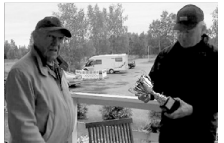
Palkintojen jako on osa kilpailutapahtumaa myös golfkisoissa.