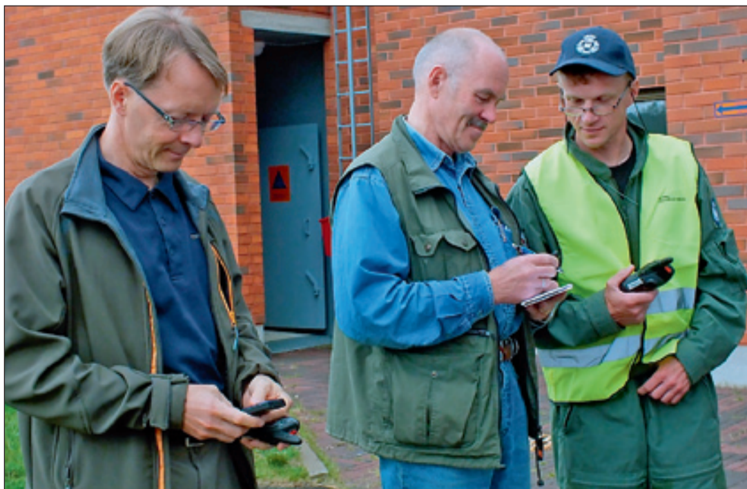
VIRVE-käyttäjäkoulutusta Ivalon lentoasemalla.

Harjoitus kokonaisuudessaan onnistui oikein hyvin. Loistavasti toimiva huolto-organisaatio ja rajavartiolaitoksen tuki mahdollistivat harjoituksen rastsuorittajien keskittymisen omaan koulutautumistehtäväänsä.