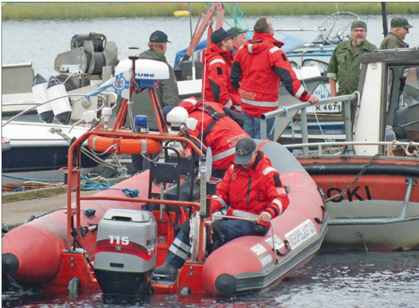
Venepartioiden liikkeelle lähtö Vaskoniemestä.

kopterit, jos pitää pystyä laskeutumaan maasto-olosuhteissa.