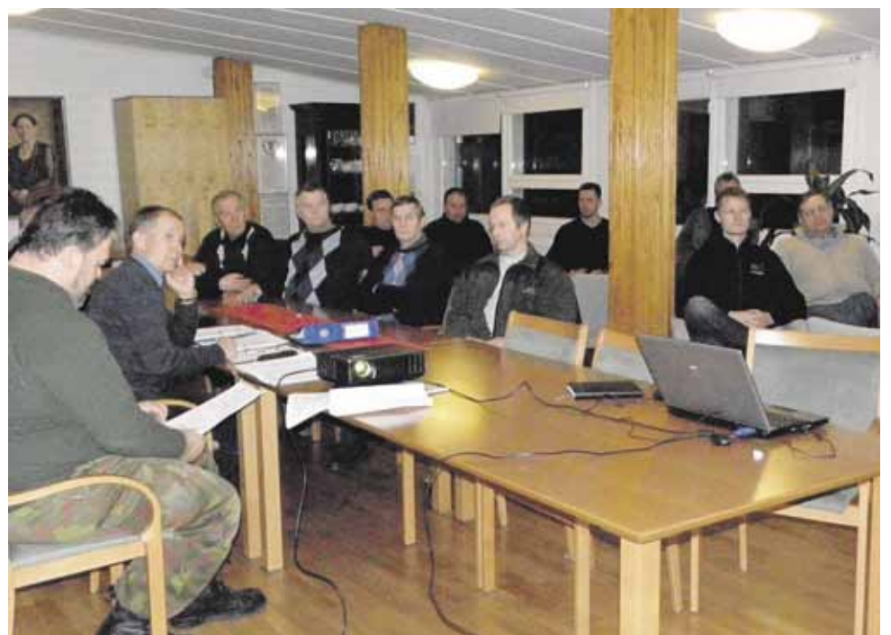
Tilaisuudessa virisi vilkas keskustelu muun muassa lupien hakemisesta.

Toivonkin jokaiselle maanpuolustajalle oikein hyvää ja antoisaa vuotta 2013!