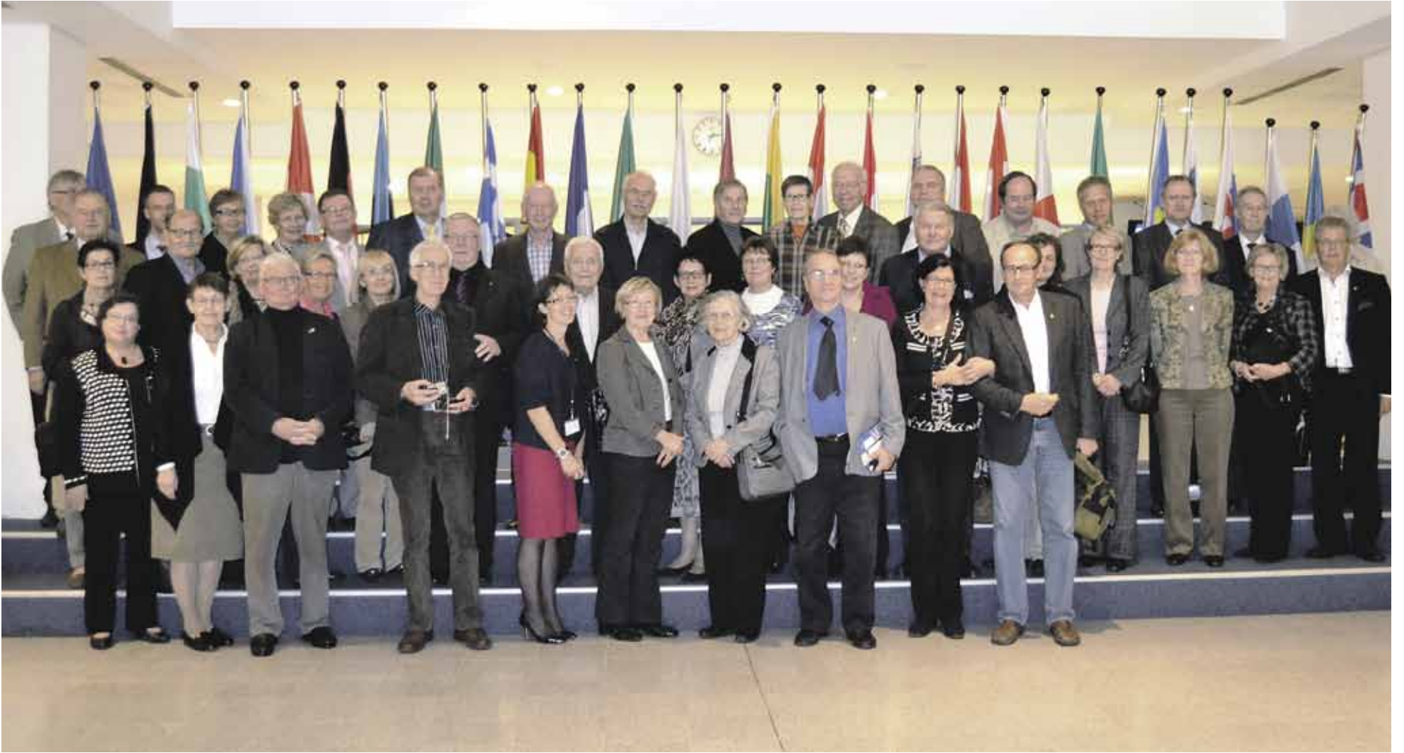
Yhdistys vieraili vuonna 2011 Brysselissä EU:n parlamentissa.