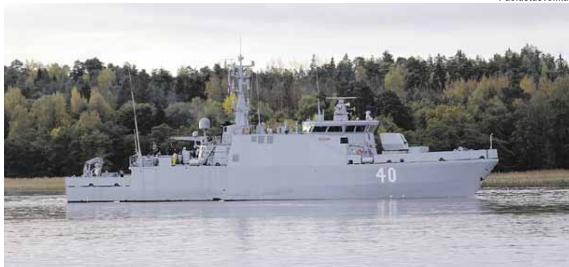
MHC Katanpää merellä lokakuussa 2012. Jääkokeet alus läpäisi tammikuussa 2013.

Katanpää-luokkaan voi tutustua muun muassa Meri kutsuu -messuilla Turun messu- ja kongressikeskuksessa 8.-10.3. merivoimien osastolla. Nähtävänä on muun muassa AUV2 Remus.