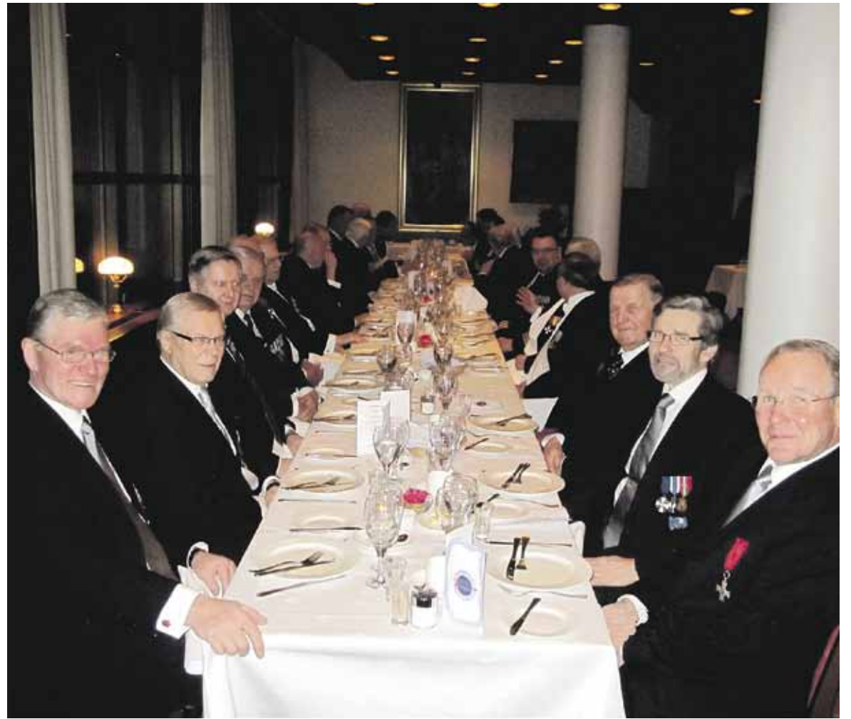
Juhlaväkeä Suomalaisella Pohjalla.