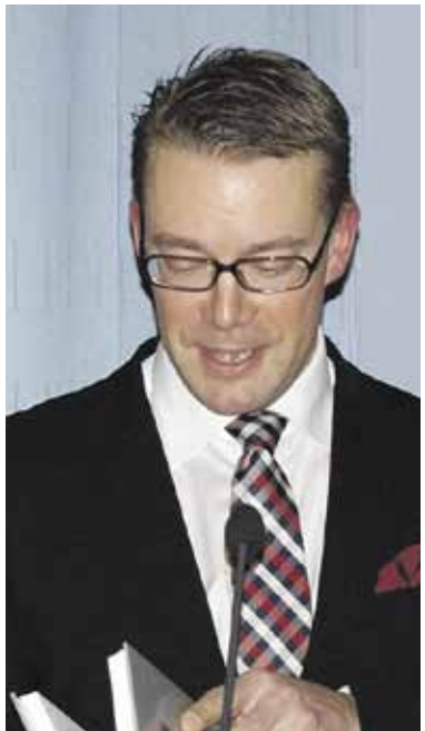
Reserinin kapteeni Stefan Wallin kävi puhumassa puolustusministerin ominaisuudessa keuhällä 2012.

otsikkona oli Jalkaväen puolustustaktiikka. Seuraavalla vuosikymmenellä esitelmä- ja koulutus-tilaisuudet keskittyivät lähinnä sotilaskoulutukseen. Ajan kuva näkyi aiheissa. Tällaisia olivat mm. Hevosten tavalliset sairaudet ja niiden hoito sekä Kannaksen maasto. Sotien jälkeisinä vuosikymmeninä osansa saivat myös talvi- ja jatkosodan tapahtumat.