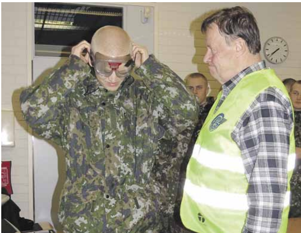
”Kännilasit” päässä voi testata, miltä humalassa ajaminen tuntuu.

Kiltä toimii niin Varsinais-Suomessa kuin Satakunnassakin eli kaikki paikalla olevat varusmiehet Saaristomeren meripuolustusalueella Pansiossa, Porin Prikaatissa Säkylän Huovinrinteellä kuin Tykistöprikaatissakin Niinisalossa pääsevät osalliseksi valistuksesta.