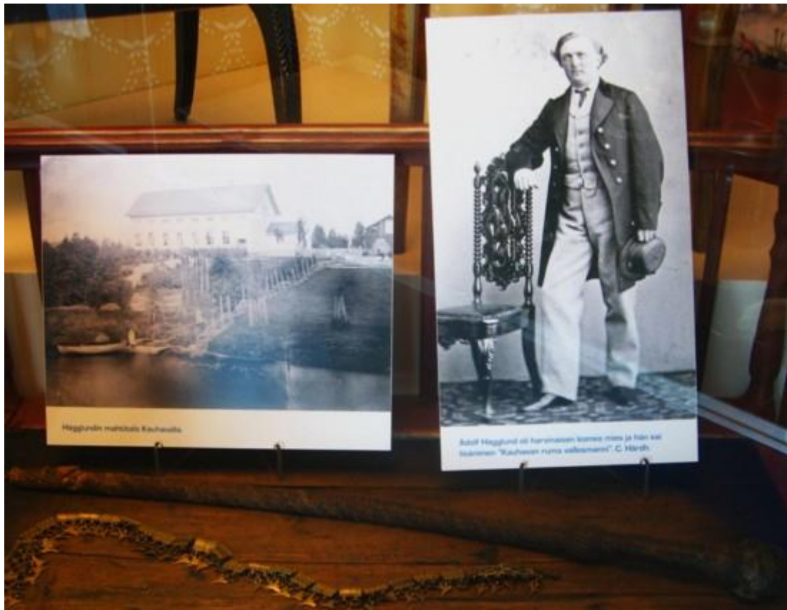
Kauhavan 'ruma' vallesmanni, hänen kotitalonsa ja tervaspamppu.