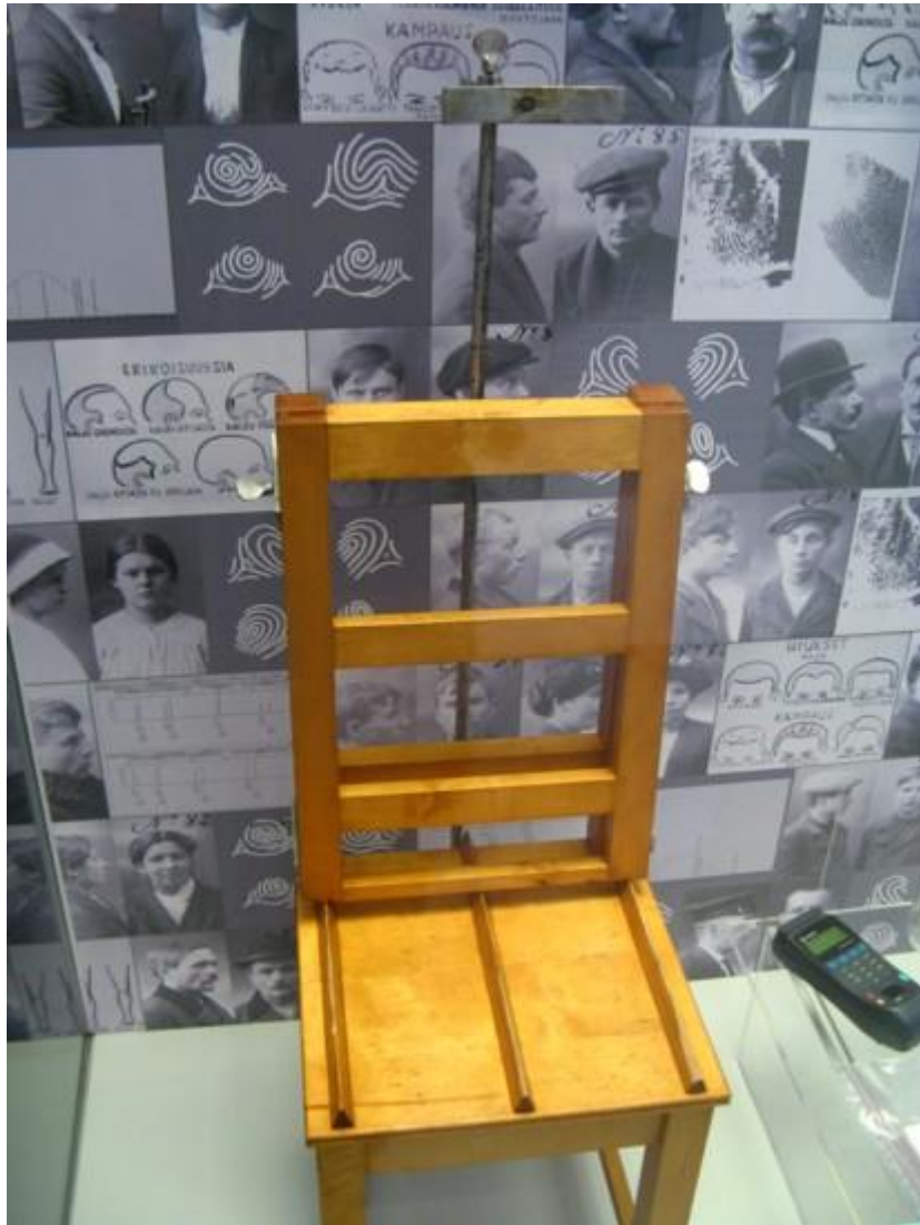
Tällä tuolilla rikolliset istuivat kuvattavina poliisin arkistoon.