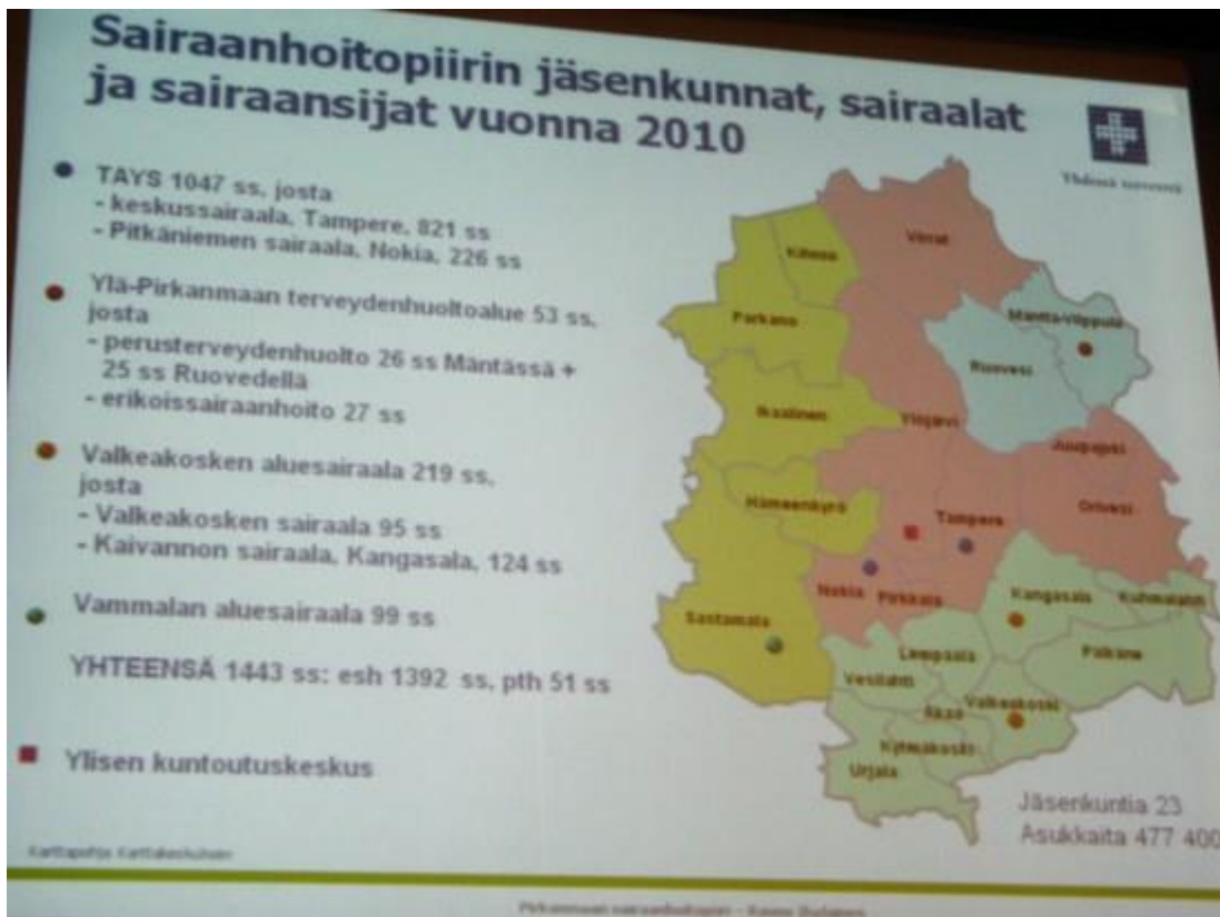
Pirkanmaan sairaanhoidopiiri