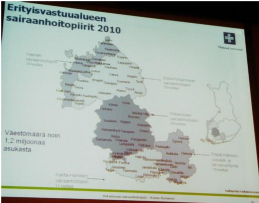
Pirkanmaan sairaanhoitopiirin erityisvastuualue, kuva Rauno Ihalaisen esitelmästä