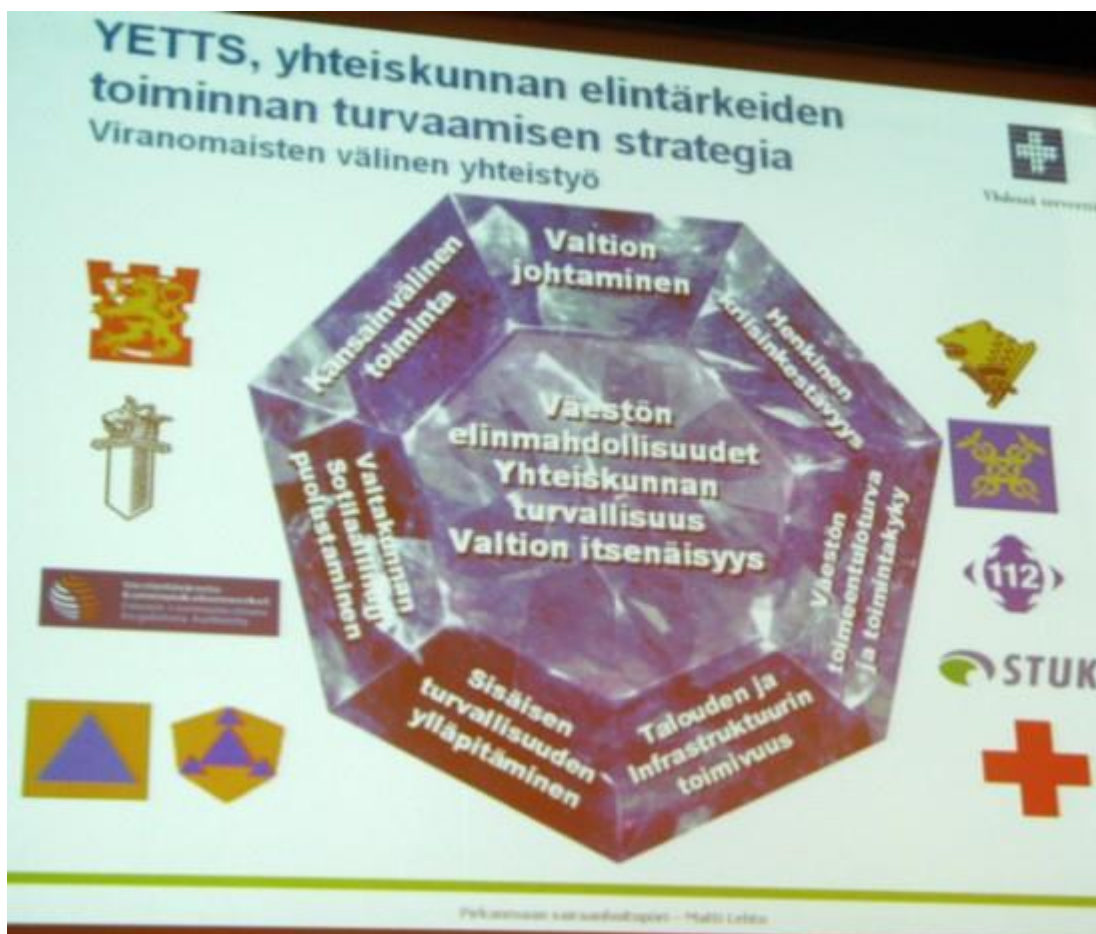
Viranomaisten välinen yhteistyö, kuva Matti Lehdon esitelmästä