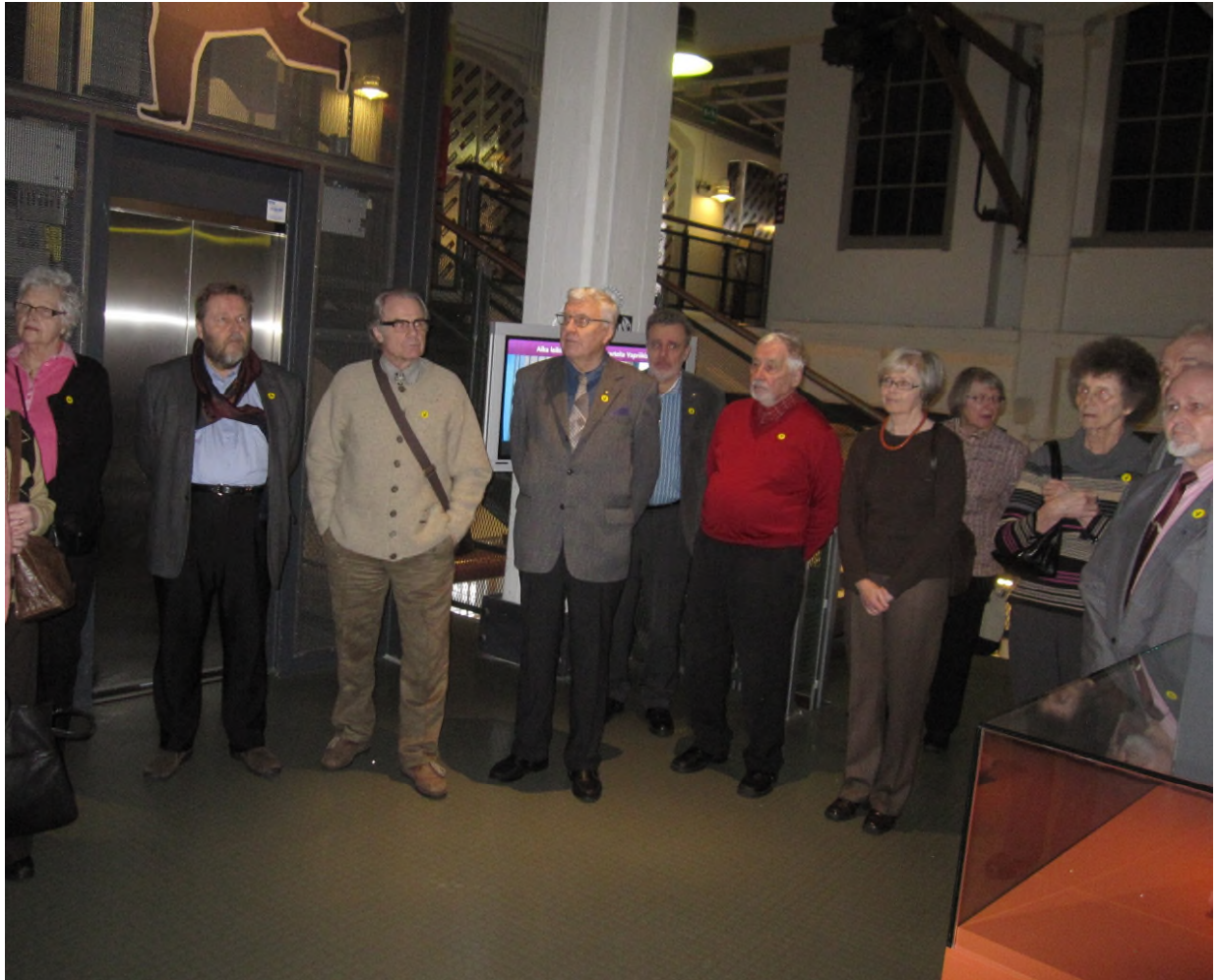
Senioreita kuuntelemassa oppaan selostusta Innovaatiot-näyttelyssä