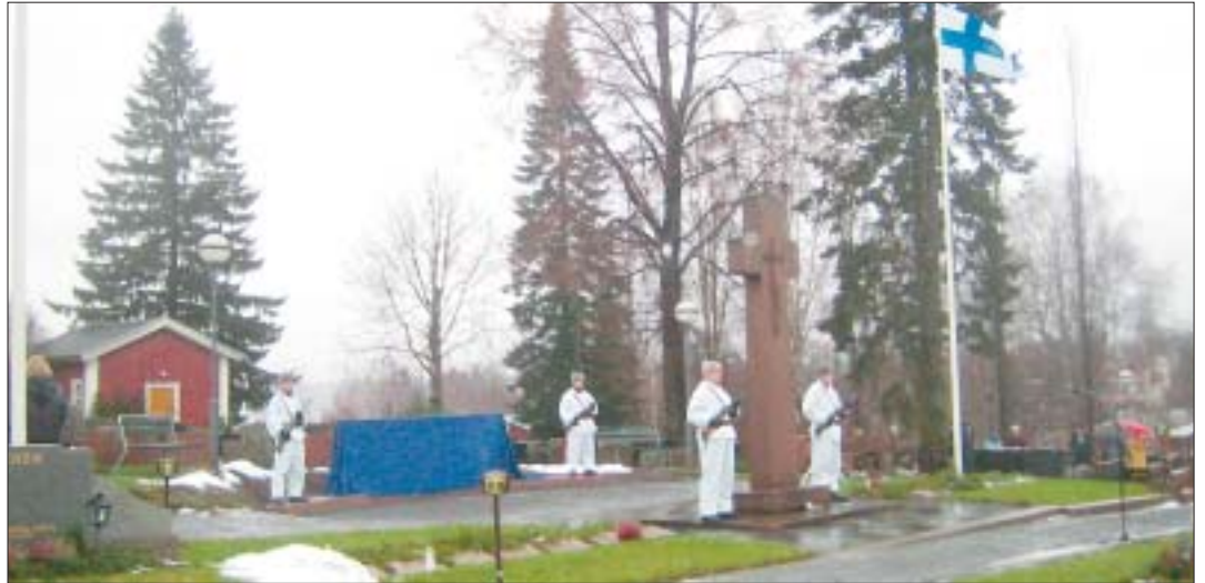
Reservijärjestöjen kunniavartio muistokiven paljastustilaisuudessa Lempäälän sankarihautausmaalla 6.12.2007.

■ 2001 syksyllä kävin kuudella sankarihautausmaalla Kittilän ja Kustavin välillä vertailemassa ki-