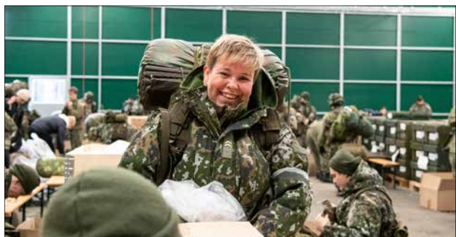
Ilmavoimien suorituskyky perustuu motivoituneeseen ja osaavaan reserviin.

Teksti: Anne Torvinen, Lapin Lennosto