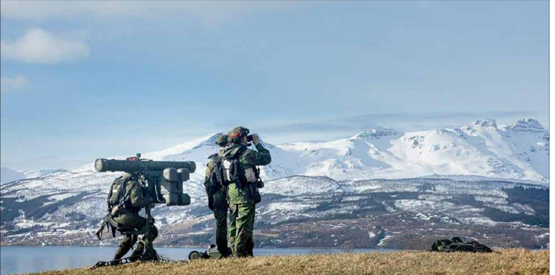
ITO05M-ohjusryhmä taisteluasemassa Norjassa CR22-harjoituksessa.