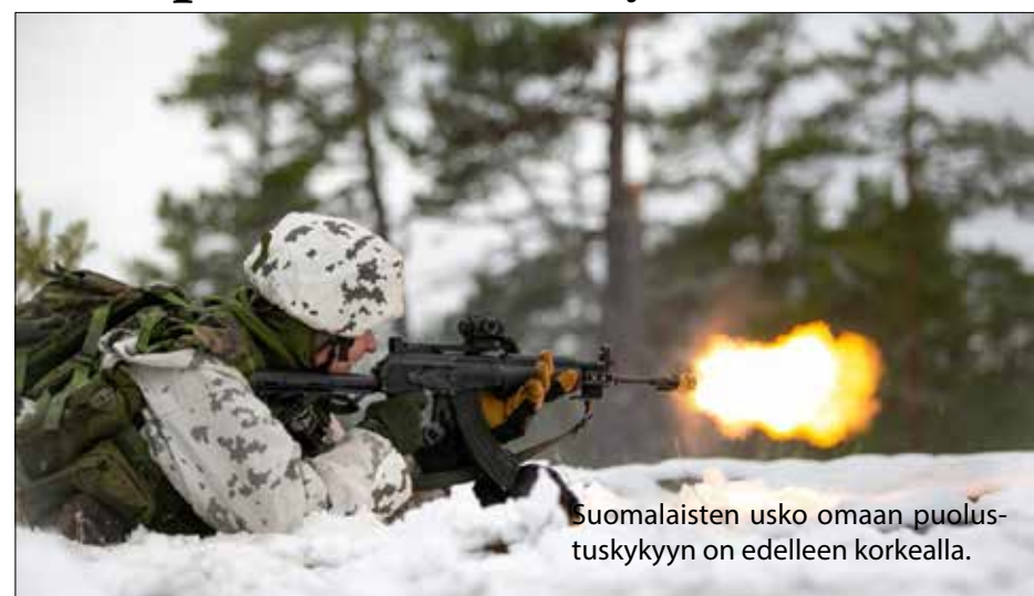
Suomalaisten usko omaan puolustuskykyyn on edelleen korkealla.

Venäjän kehitys ja energian riittävyys koetaan tällä hetkellä suurimmiksi uhkakuiksi.