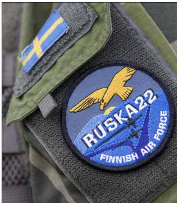
Ruska 22 oli Ilmavoimien tämän vuoden pääsotaharjoitus.