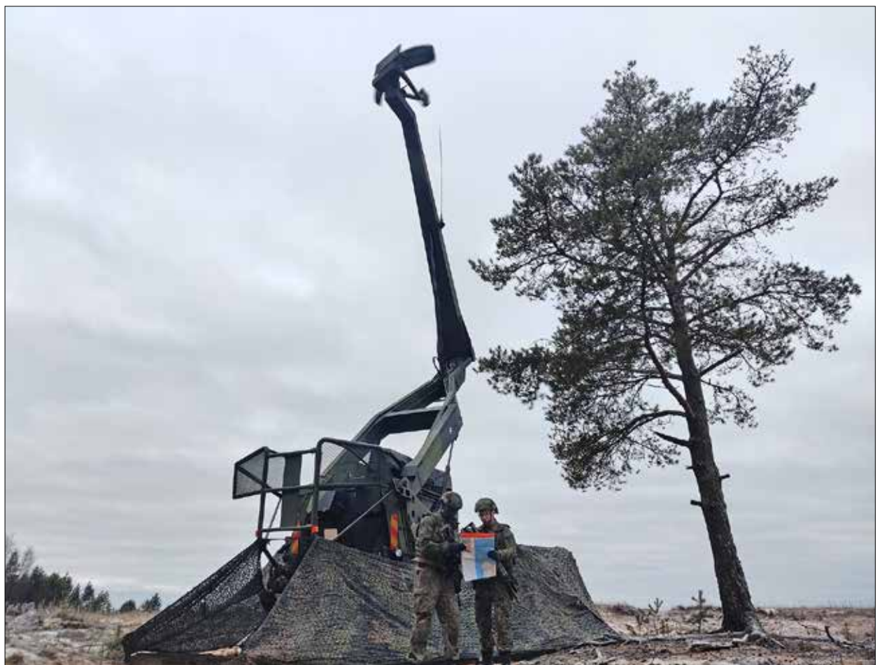
Maalinosoitustutka (MOSTKA 87M) mittausasemassa ilmapuolustusharjoituksessa (IPH222) marraskuussa 2022.

Lähimenneisyydessä patteriston ehkä leimaintavin piirre on ollut sen profiloituminen Crotalejärjestelmän (ITO90M) pääkoulutuspaikkana ja viimeisten vuosien osalta ainoana ilmatorjunnan joukkoyksikkönä, joka kyseessä olevaa järjestelmää kouluttaa. Toinen menneisyydestä kumpu-