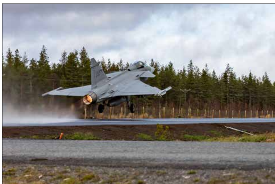
Rovaniemelle tukeutunut ruotsalainen Gripen-osasto integroitiin Ruska 22 -harjoituksessa osaksi ilmapuolustustehtäviä harjoittelevaa joukkoa. Gripenit kävivät laskussa ensi kertaa myös Pudasjärvellä.