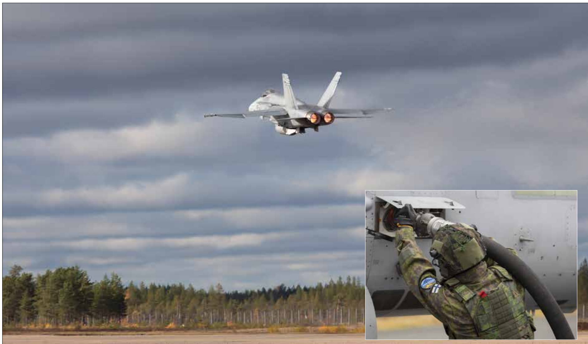
Ilmavoimien F/A-18 Hornet –monitoimihävittäjät tukeutuivat muun muassa Pudasjärven lentokentälle.