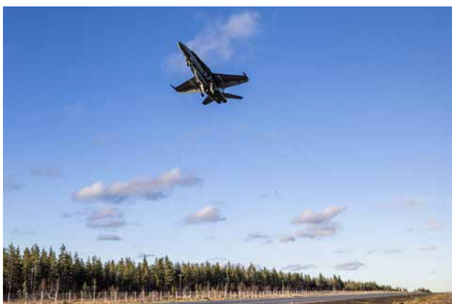
Harjoituksessa otettiin käyttöön juuri valmistunut Norvatin varalaskupaikka Rovaniemellä.