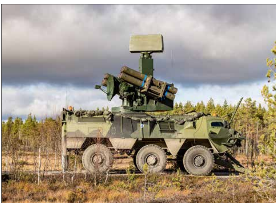
Pudasjärven tukikohtaa suojaava harjoitukseen osallistuva ITO90M Crotale -ilmatorjuntayksikkö.