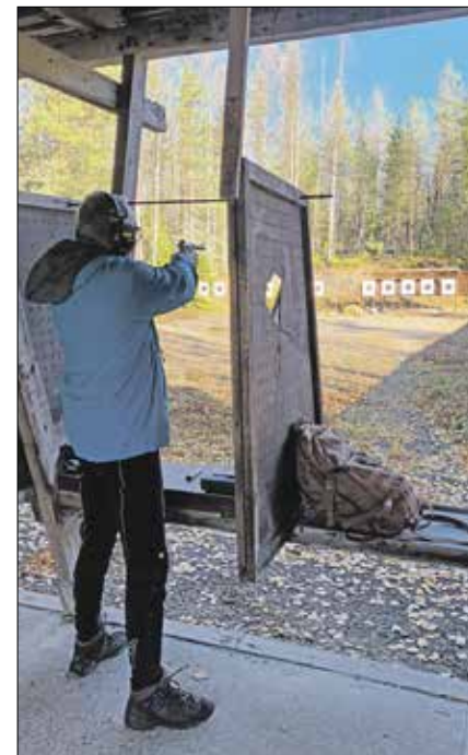
Kuvissa Hannun tyylinäyte.

ammuntarutiinin ja nastasta 85, jolloin 5 minuuttia juoksuaajan miehen kunnan olevan sakkoa tuli 15 pistettä*20 päälle 24,24. rautaa. Pisteet ammun- sekuntia ja aikasakkoa MAARIT TIMONEN