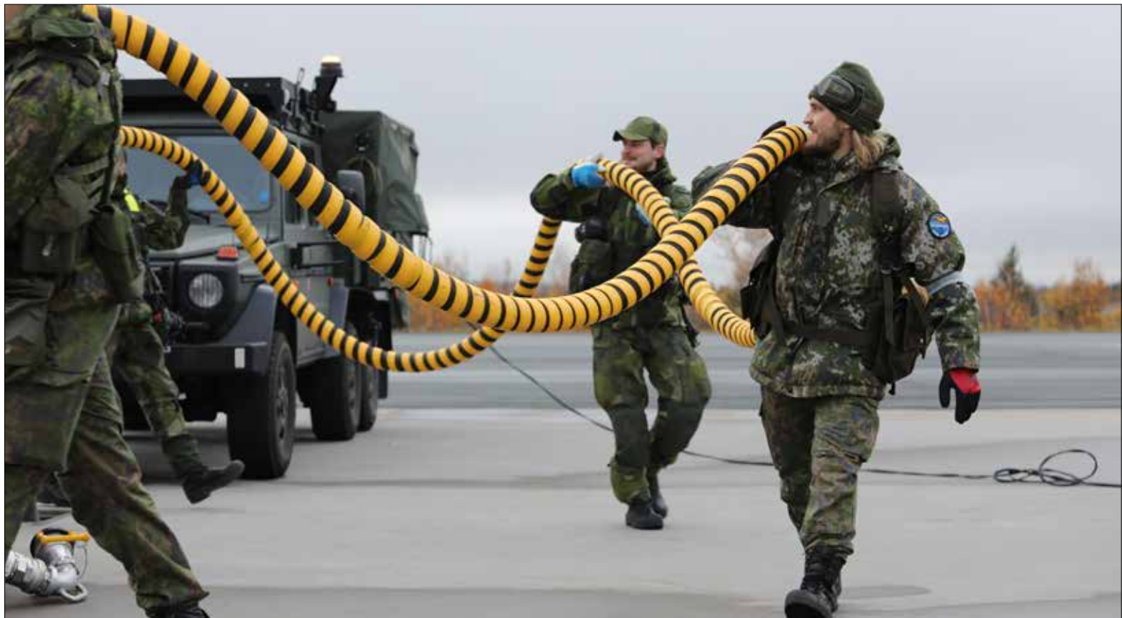
Lapin lennoston reserviläiset pääsivät harjoittelemaan yhteistointia ruotsalaisten kanssa.

Harjoitukseen osallistuvat lentokoneet jakautuivat ilmapuolustustehtäviä harjoitteluun ja harjoitusvastustajaa kuvaavaan joukkoon. Koneet tukeutuivat Ilmavoimien liikkuvan taistelutavan mukaisesti useille lentopaikoille eri puolilla Suomea.