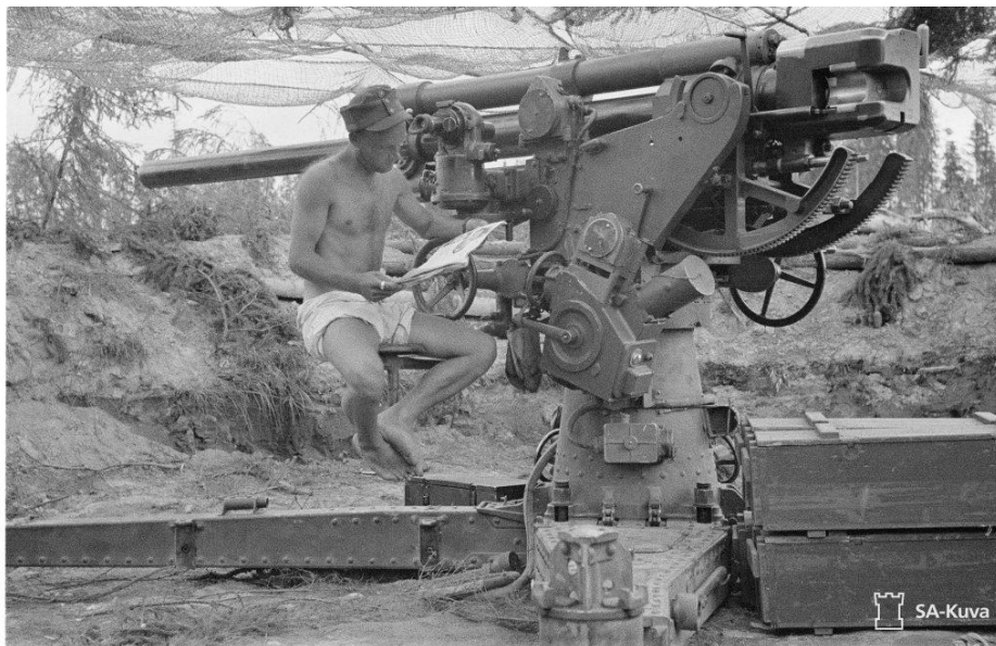
103. Raskas Ilmatorjuntapatteri, jonka yksi tykki oli siirretty panssaritorjuntaan Syvärin voimalaitoksen maastoon. 28.6.1942.