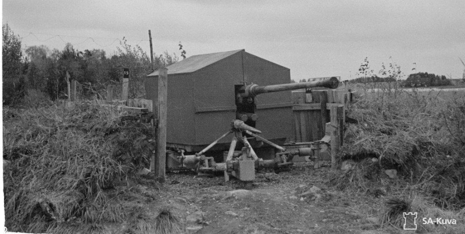
87. Kevyen Ilmatorjuntajaoksen kanuuna 40 ITK 38 (Bofors) asemissa sääsuojassa Varkaudessa. 10.10.1944.

Boforsin 40 millimetrin ilmatorjuntakanuuna oli ruotsalaisen Bofors-tehtaan kehittämä ilmahyökkäysten torjuntaan suunniteltu sarjatuliase, jonka suunnittelu aloitettiin vuonna 1928. Tykin tekniset ominaisuudet: