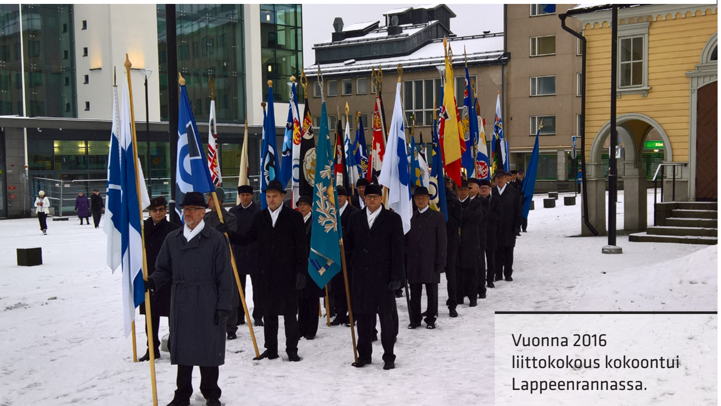
Vuonna 2016 liittokokous kokoontui Lappeenrannassa.

on lauantaina seuralaisohjelmaa ja päivä huipentuu yhteiseen iltajuhlaan Radisson Blu Marinan tiloissa. Sunnuntaina ohjelma jatkuu jumalanpalveluksella Turun tuomiokirkossa, jota seuraa lippulinna. Lippulinnaan toivotaan runsain määrin piirien ja yhdistysten lippuja. Viikonlopun ohjelman päättää valtakunnallinen maanpuolustusjuhla.