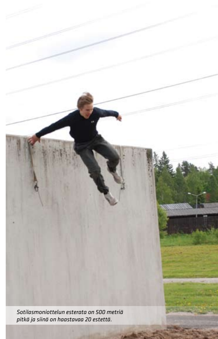
Sotilasmoniotellun esterata on 500 metriä pitkä ja siinä on haastavaa 20 estettä.