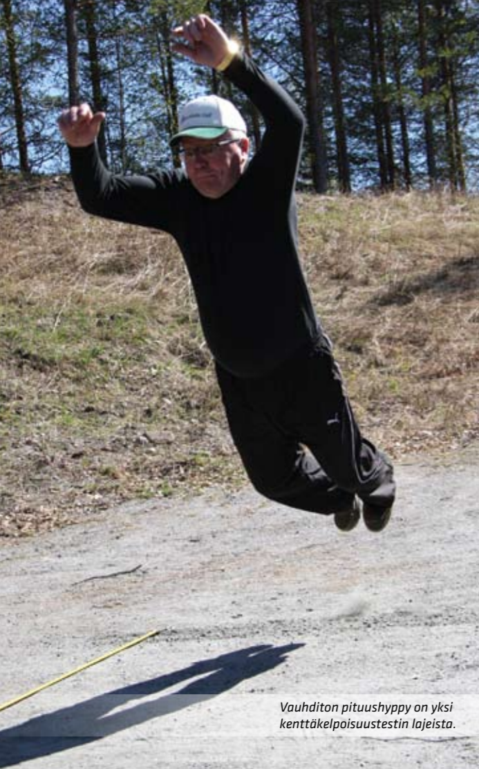
Vauhditon pituushyppy on yksi kenttäkelpoisuustestin lajeista.