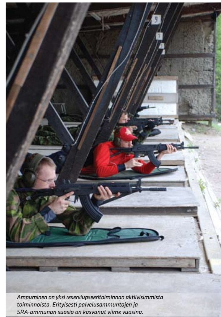
Ampuminen on yksi reserviupseeritoiminnan aktiivisimmista toiminnoista. Erityisesti palvelusammuntojen ja SRA-ammunnan suosio on kasvanut viime vuosina.