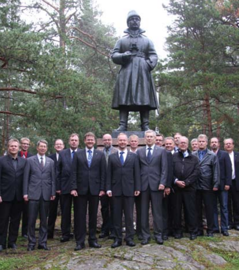
RUL:n liittohallitus teki syyskuussa kunniakäynnin Tampereen Vehmaisissa olevalle C.G.E. Mannerheimin patsaalle. Mannerheim kutsuttiin RUL:n kunniapuheenjohtajaksi vuonna 1941.