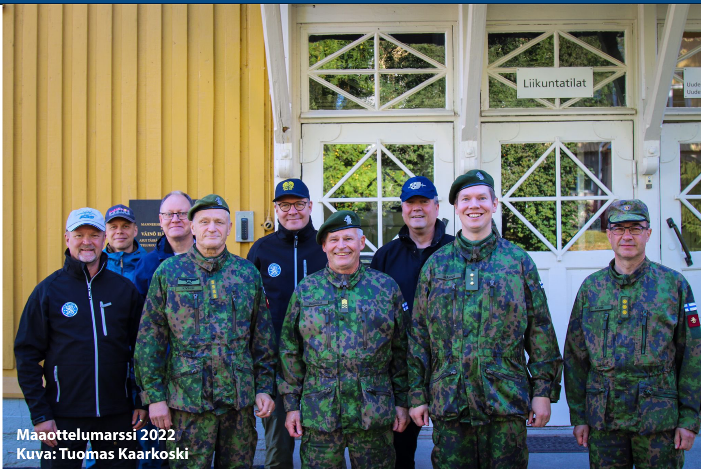
Maaottelumarssi 2022