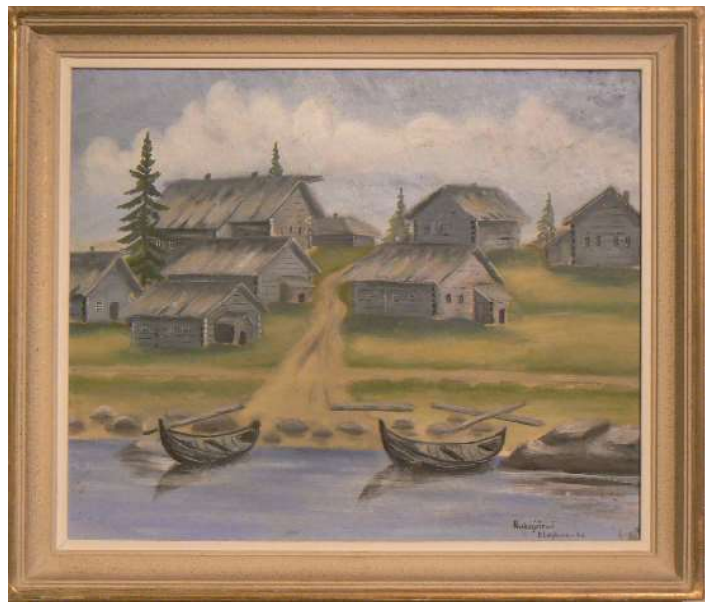
14.D:n esikunnassa lähettinä toimineen taiteilija Pentti Lehtisen Rukajärven kylää esittävä maalaus. Tämän teoksen hankkimisesta käynnistyi Rukajärven rintaman taideteosten keräystyö.

Näyttelyyn sisältyy myös KTR 18 paterinpäällikkönä toimineen Erkki Matilaisen (25.4.1913 – 7.2.1986) töitä. Matilainen toimi sodan jälkeen opettajana. Ensin Iisalmen, josta perhe muutti Lieksaan.