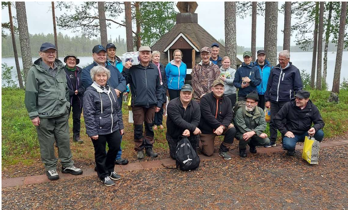
Suomussalmen Reserviupseerit /Reserviläiset tekivät kesäretken venäläisten partisaanien iskupaikoille. Osanottajien määrää verotti eri tapahtumien päällekkäisyys samalle päivälle.

Suomussalmella ei ole unohdettu jatkosodan aikana tehtyjä venäläisten partisaani-iskuja vuosikymmenien jälkeenkään. Kesällä 1943 kohdistui iskut Ylivuokin kyliin Malahviaan, Viiankiin, Hyryyn ja Tuppuriin. Näissä hyökkäyksissä menetti henkensä lähes 40 ihmistä, joista 4 oli sotilaita. Kaikkiaan partisaani-iskuja tehtiin Suomessa 45, näistä kuusi Suomussalmella.