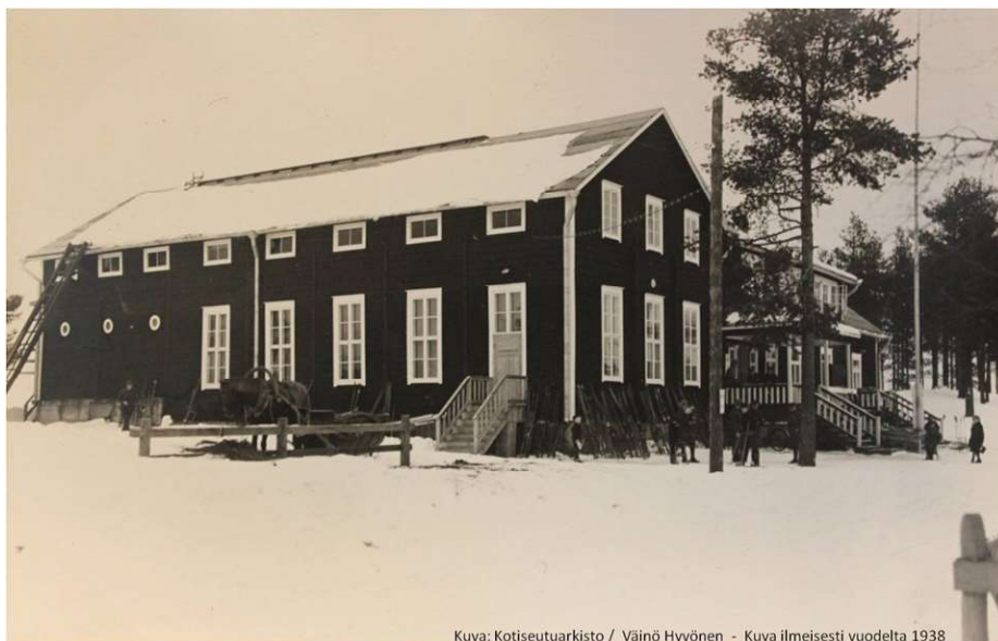
Kuva: Kotiseutuarkisto / Väinö Hyvönen - Kuva ilmeisesti vuodelta 1938

Yhteiskunnallisesti maakunnallisista ja muista tapahtumista Sotilaspojat tuppaa vaan unohtumaan. Me teemme aktiivista yhteistyötä Kainuun Lot-taperinne yhdistyksen kanssa, pitkälti yhteiset tapahtumat aktivoivat toimintaa. Vuonna 2010 tehtiin sääntömuutos, joka antoi mahdollisuus muidenkin kuin sotilaspoikien liittyä jäseneksi, säännöissä sanotaan: Killan täysivaltaiseksi jäseneksi pääsee ikään ja sukupuoleen katsomatta isänmaallisesta harrastuksesta tunnettu mies tai nainen, joka hyväksyy