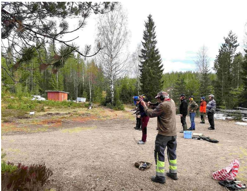
Ristijärven Reserviläisten pistooliammunnat.

Jäsenillä on Whatsapp-ryhmä, jonka välityksellä viestintä toimii.