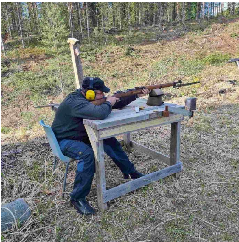
Ristijärven Reserviläisten harjoituksissa 30.5 ammuttiin myös vanhemmilla aseilla.