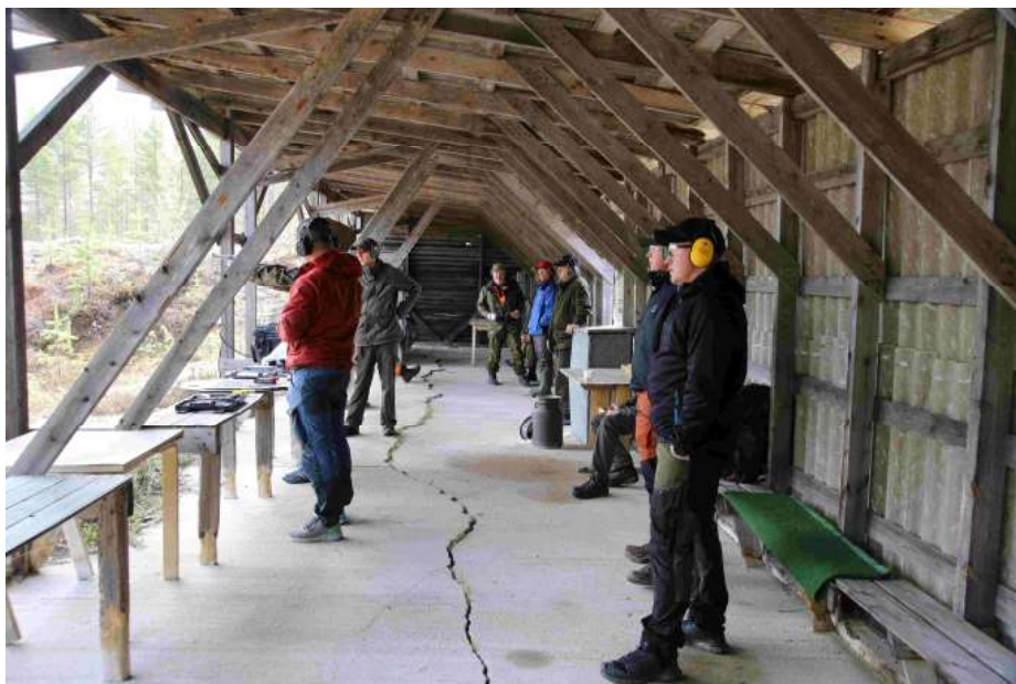
Puolangan reserviläisillä on käytössä Puolangan Ampujien Soidinkankaan ampumarata. 18.5 amuntoihin osallistui parikymmentä reserviläistä.

Jokaista reserviläistä kannustetaan suorittamaan mahdollisimman monta, mutta vähintään yksi kymmenen laukauksen sarja toukokuun aikana. Jokaisesta päivästä, jolloin on ampuunut vähintään kymmenen laukausta, saa suoritusmerkinnän oman yhdistyksensä kokonaissuoritusmäärään. Viime vuonna Tulta toukokuussa! -haasteen aikana ammuttiin yli puoli miljoonaa laukausta