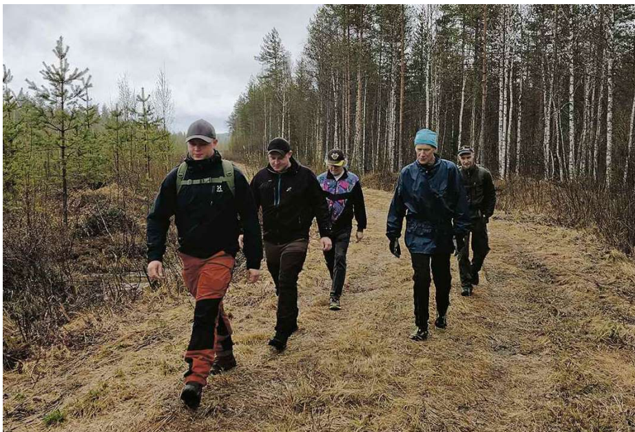
Marssille osallistui kuusi henkilöä.

Järjestetyissä ammunnoissa opetellaan aluksi turvallinen aseenkäsittely ja käyttäytyminen ampumaradalla. Valvonnan alla voi ampua toisen aseella ja Puolangan reserviläisillä on oma pistooli, jolla voi ampua pistooliammuntoja.