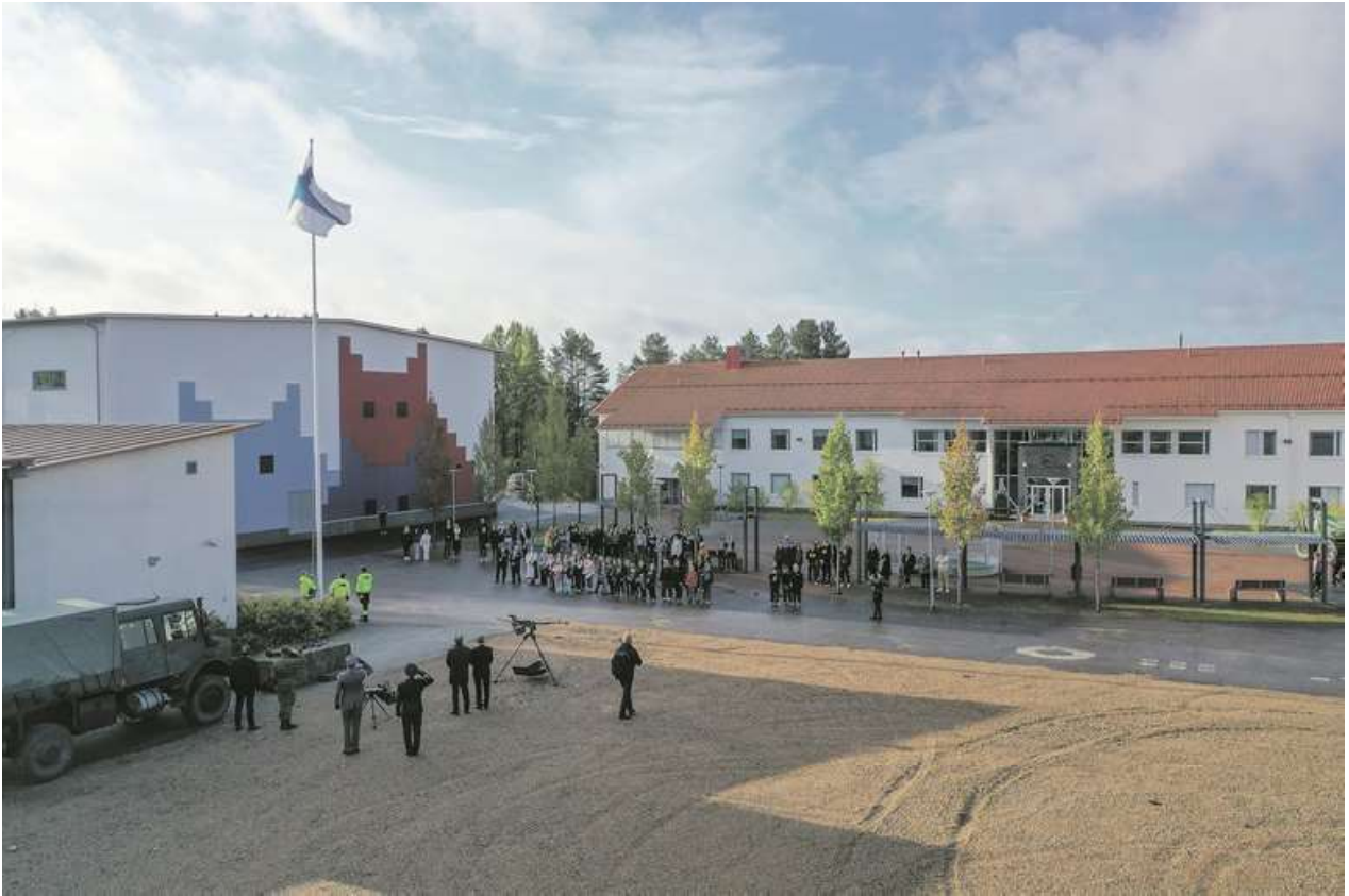
Juhlapäivä alkoi lipunnostolla Puolankajärven koululla.