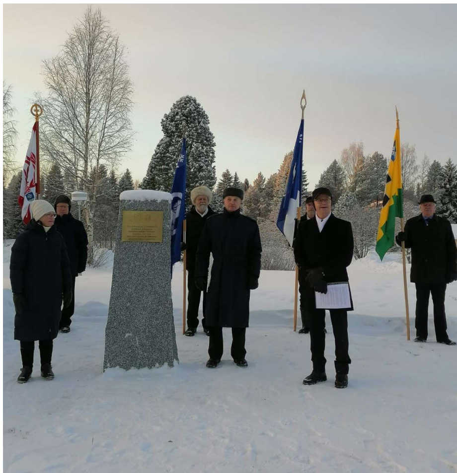
Ristijärven reserviläisjärjestöt pystyttivät muistokiven suojeluskuntatalon entiselle paikalle.

Syyskuussa 1945 Ristijärven kunnanvaltuusto päätti perustaa Suomelan tiloihin kunnansairaalan. Asiassa lie-nee ollut joitakin mutkia, sillä lopullinen päätös perustamisesta tehtiin uudessa kokouksessa 15.2.1946.