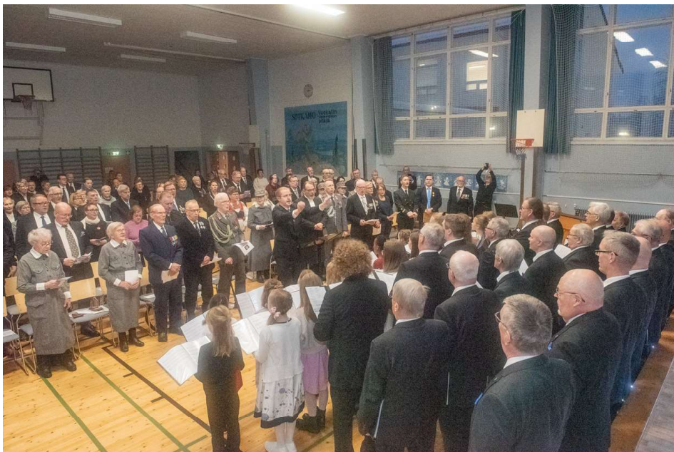
Juhla päättyi Maamme-lauluun, yleisö, Sotkamon Mieslaulajat ja Salmelan Sävel -lapsikuoro

Kainuun sotilaspoikien keskuudessa oli syntynyt keskustelua oman perinneyhdistyksen perustamisesta. ja niinpä perustamiskutsu julkaistiin Kainuun Sanomissa. Kutsu herätti keskustelua entisten sotilaspoikien kesken. Olemmeko jo valmiita muistelemaan isänmaamme hyväksi nuorina poikina yli 50 v. sitten tekemäämme työtä. Se nostatti monenlaisia muistoja, tunnekuohuja, joita pohdimme ja kuulostelimme, miten yleinen mielipide ottaa meidät vastaan. Jotkut varoittelivat sanoen, että kokoatteko te taas jotakin suojeluskuntaa. Muitten puheet eivät lannistaneet ja Perustava kokous pidettiin Ristijärven kunnan valtuustosalissa 29.12.1993.