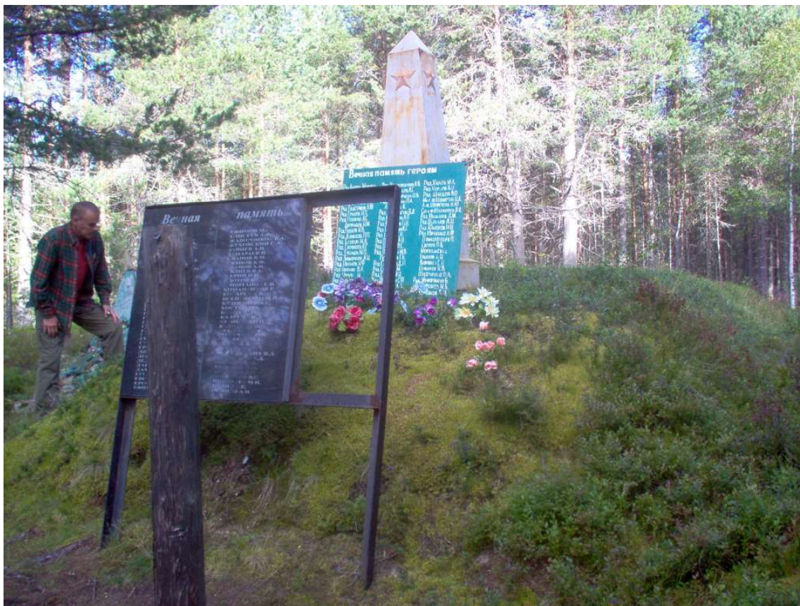
Talvisodassa Kuhmon suunnalla kaatuneiden venäläisten sotilaiden joukkohauta Kolvasjärvellä 2012.