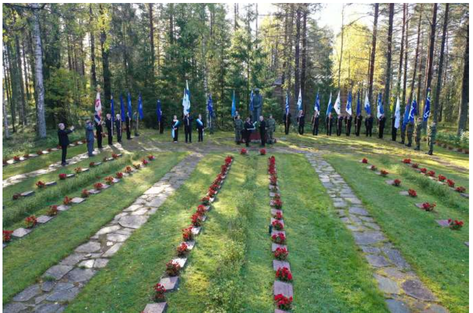
Sepeleiden lasku sankarihaudoilla

- Esimerkiksi viime keväänä samaisessa tilaisuudessa meillä vieraili yhden päivän aikana yli tuhatta koululaista.