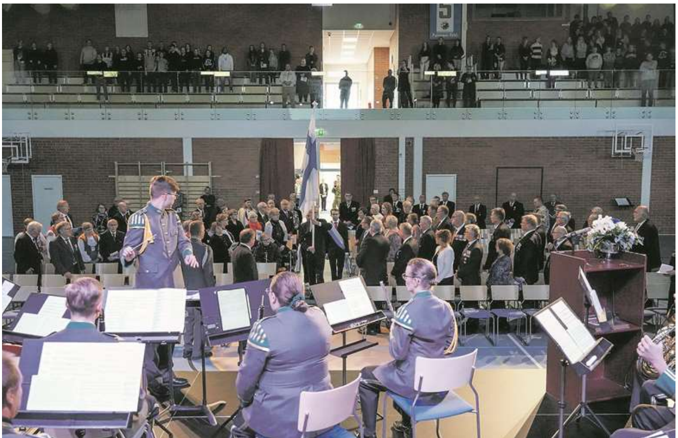
Suomen lippu saapui juhlaan Lippulaulun ja Lapin sotilassoittokunnan tahdittamana. Sotilassoittokunta soitti maanpuolustusjuhlassa useita kappaleita.