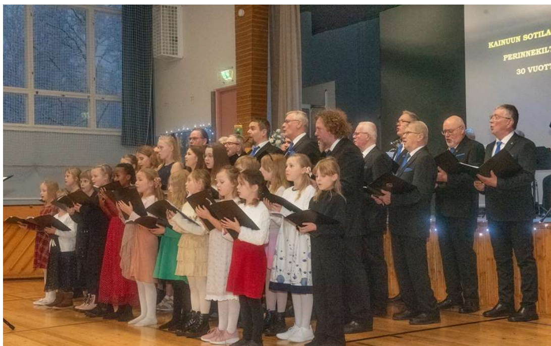
Salmelan Sävel ja Sotkamon Mieslaulajat esittivät yhteisesti Finlandian.