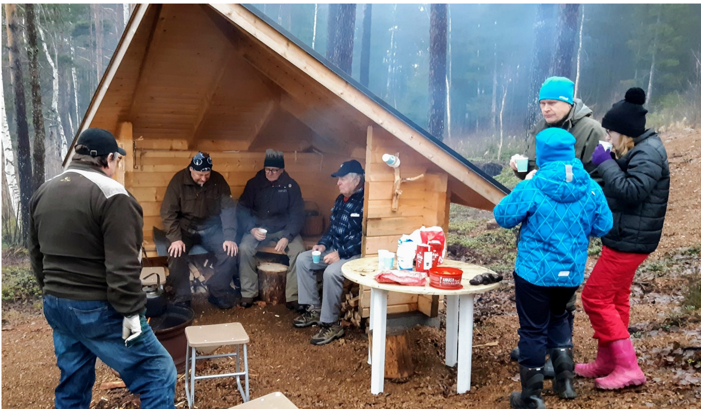
Lögiä ja joulupipareita varsin kesäisissä maisemissa