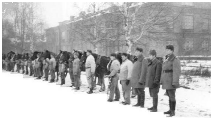
Hevostarkastus RUK:ssa

Kuormastojoukkue kuului KymJP:n uuden perusyksikön, varuskuntakomppaniaan kokoonpanoon.