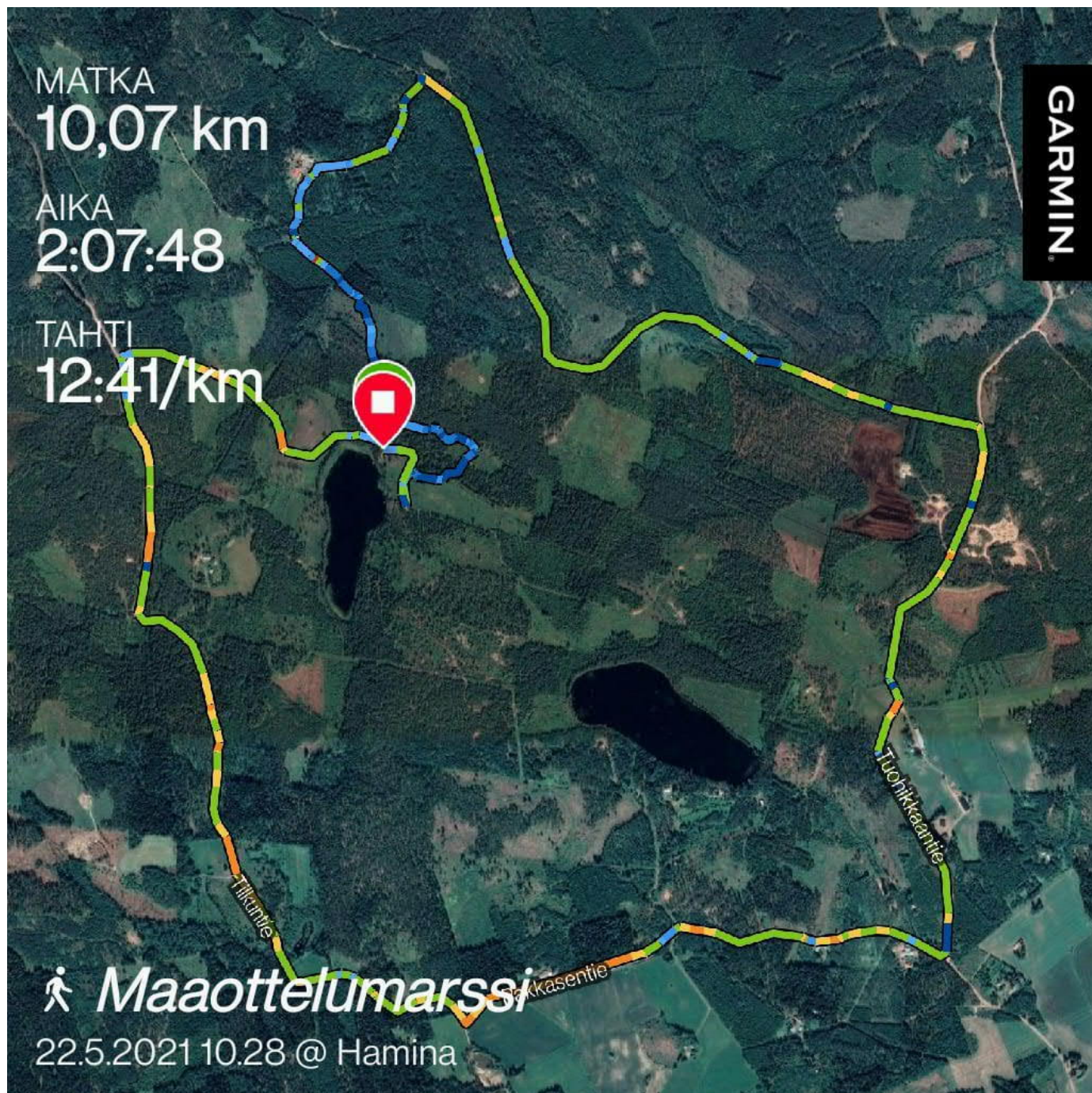
Marssireitti GPS laitteelta