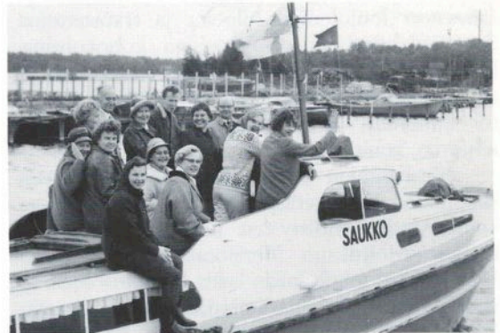
Laiva on lastattu – retki alkaa.