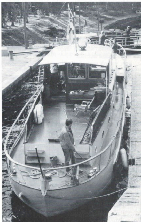
Vesikko uudessa asussa Varistaipaleen museokanavassa