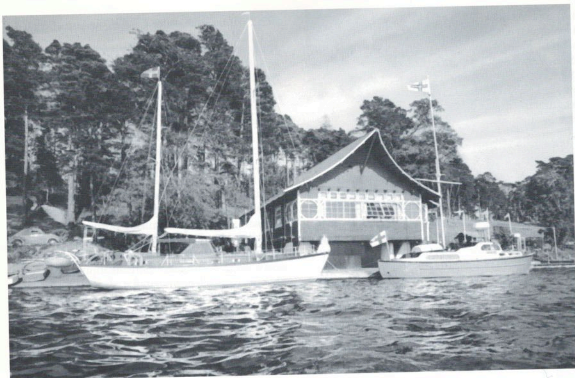
Kuvassa m/v Saukko Maarianhaminan länsisatamassa ikuistettuna oolantilaiseen postikorttiin