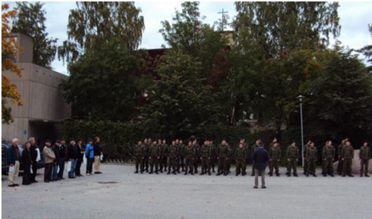
Keräysjohtajat ja Panssariprikaatin 40 varusmiestä tulopuhuttelussa 20.9.