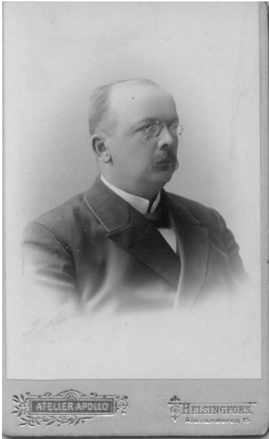
Pääministeri Lauri Ingman 27.11.1918 – 17.4.1919