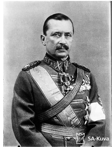
Valtionhoitaja Gustav Mannerheim 12.12.1918 – 25.7.1919