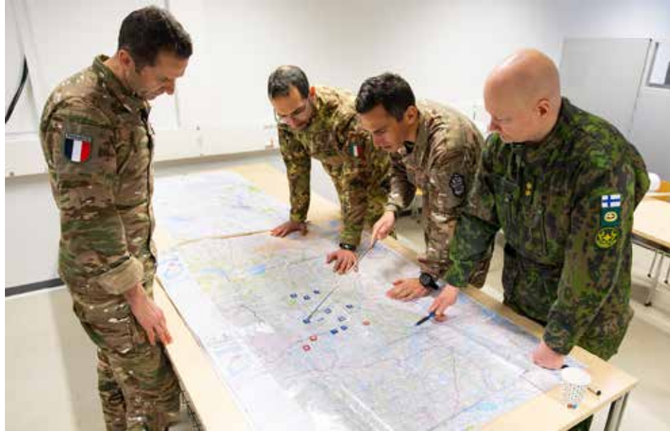
Karttatarkastelussa hiotaan Red Forin operaatiosuunnitelmaa.

kastaja eversti Ari Mure kirjoitti vuosi sitten tässä samaisessa julkaisussa, otsikolla kansainvälinen toiminta jatkuu . Näin on myös tapahtunut. Jääkäriprikaati johti alkukevällä mittavan Cold Response 26 -harjoituksen Site Finland Land -osuuden. Itse pääsin toimimaan harjoituksessa ns. Red Forin komentajana. Johdossani ollut prikaati kuvastaa kansainvälisyyttä hyvin. Prikaatin pääjoukoista yhden muodosti ranskalaisen johtama ranskalais-italialainen