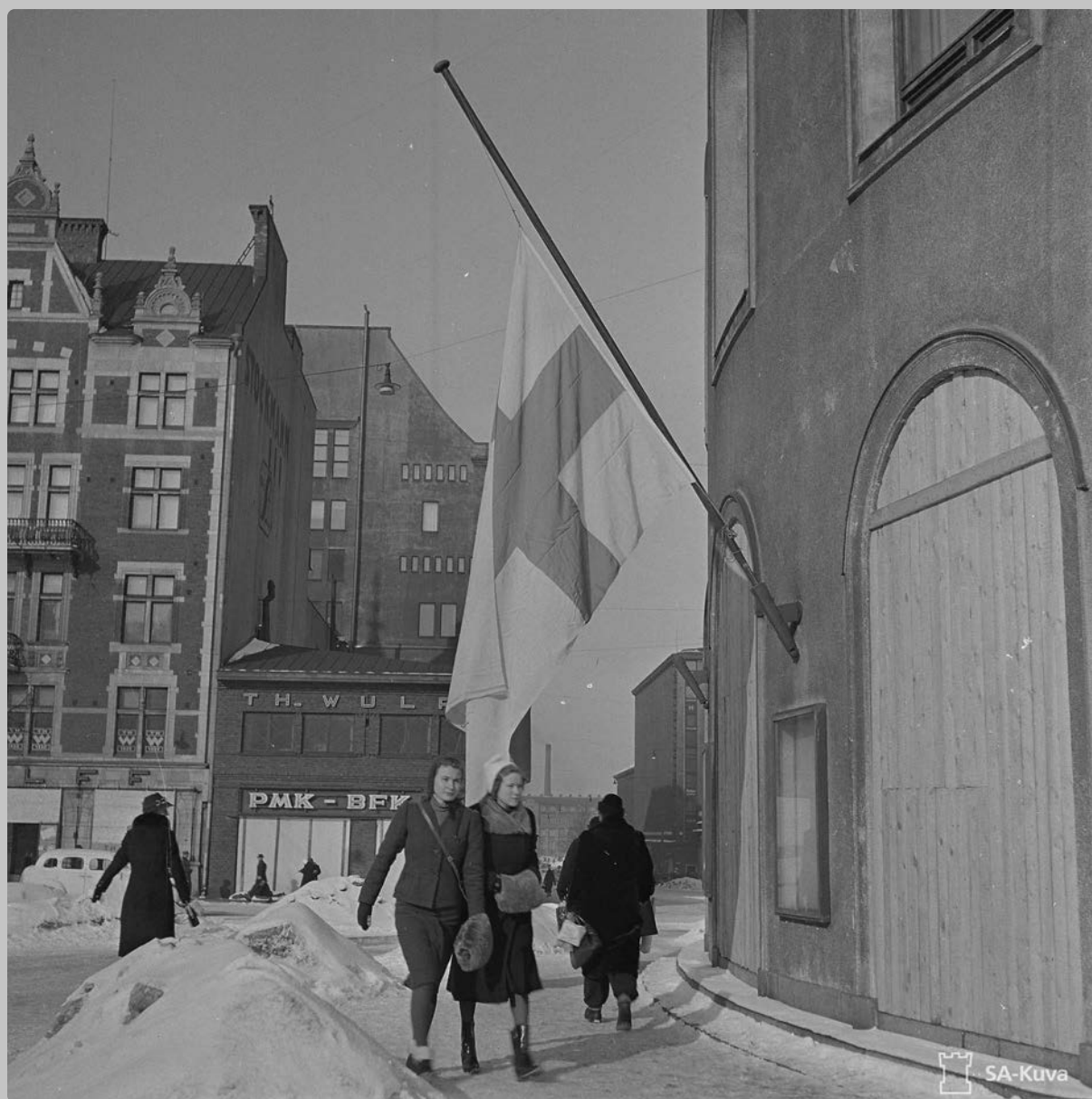
Talvisodan ankariin rauhanehtoihin reagoitiin voimakkaasti mm. suruliputuksella Helsingissä.