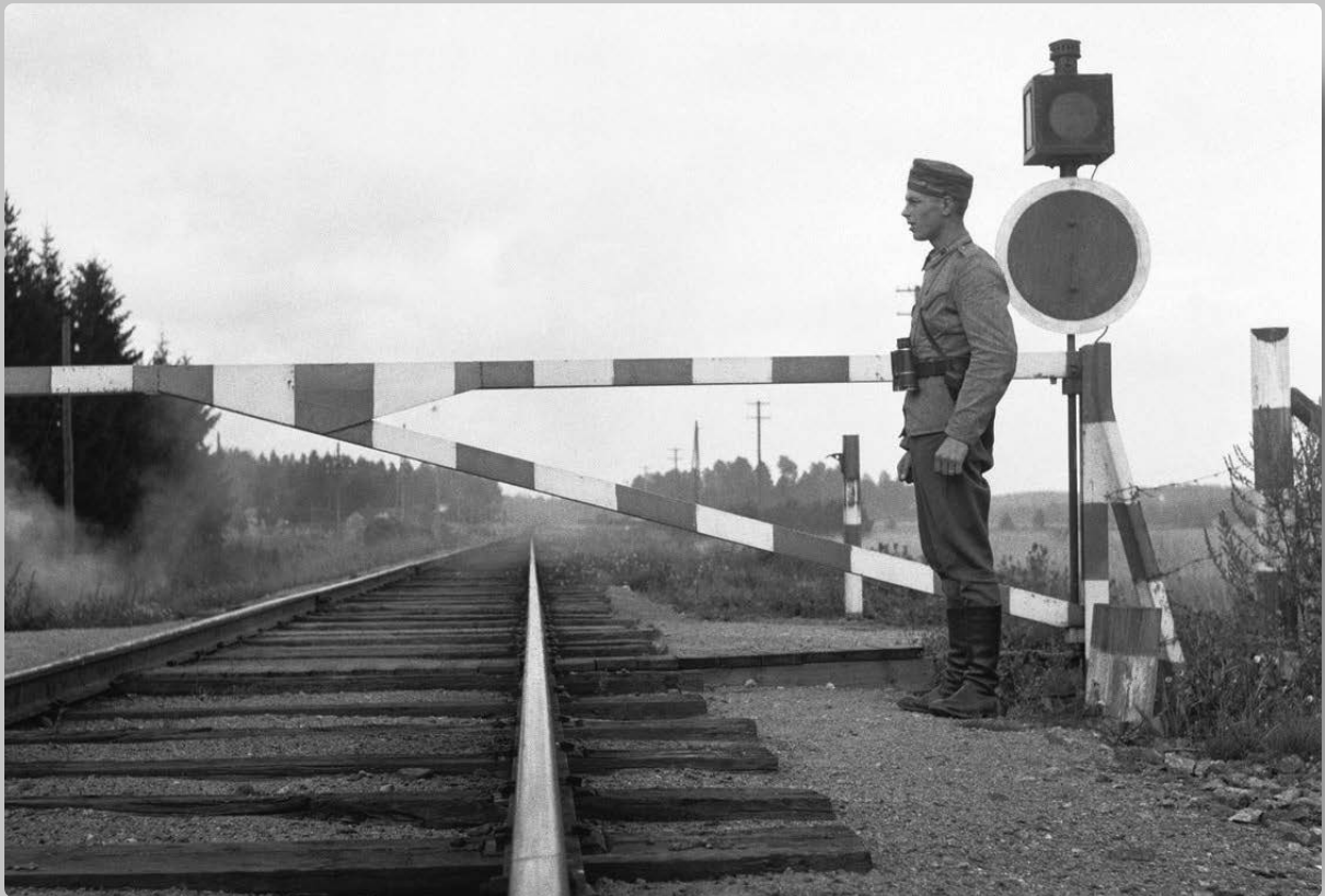
Raja Porkkalan vuokra-alueelle sulkeutui syyskuussa 1944, Porkkalan raja-alue, 19.8.1953.