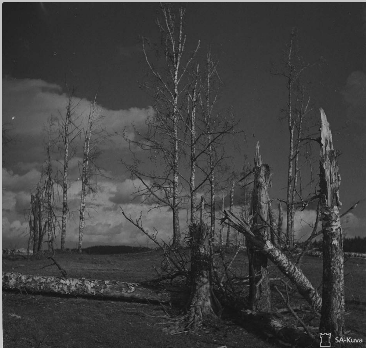
Raadeltu metsä sotiemme lopun eräänä kuvana SA-kuva 162932, Sot.virk. O.Lindh, Ihantala.