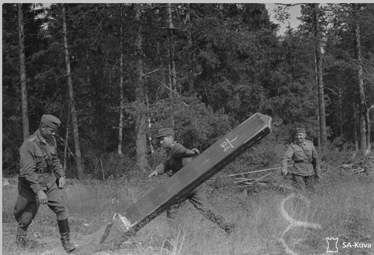
Hiitolassa ryssän rajapylväs I/94 kaatuu. Hiitola, 29.6.1941.