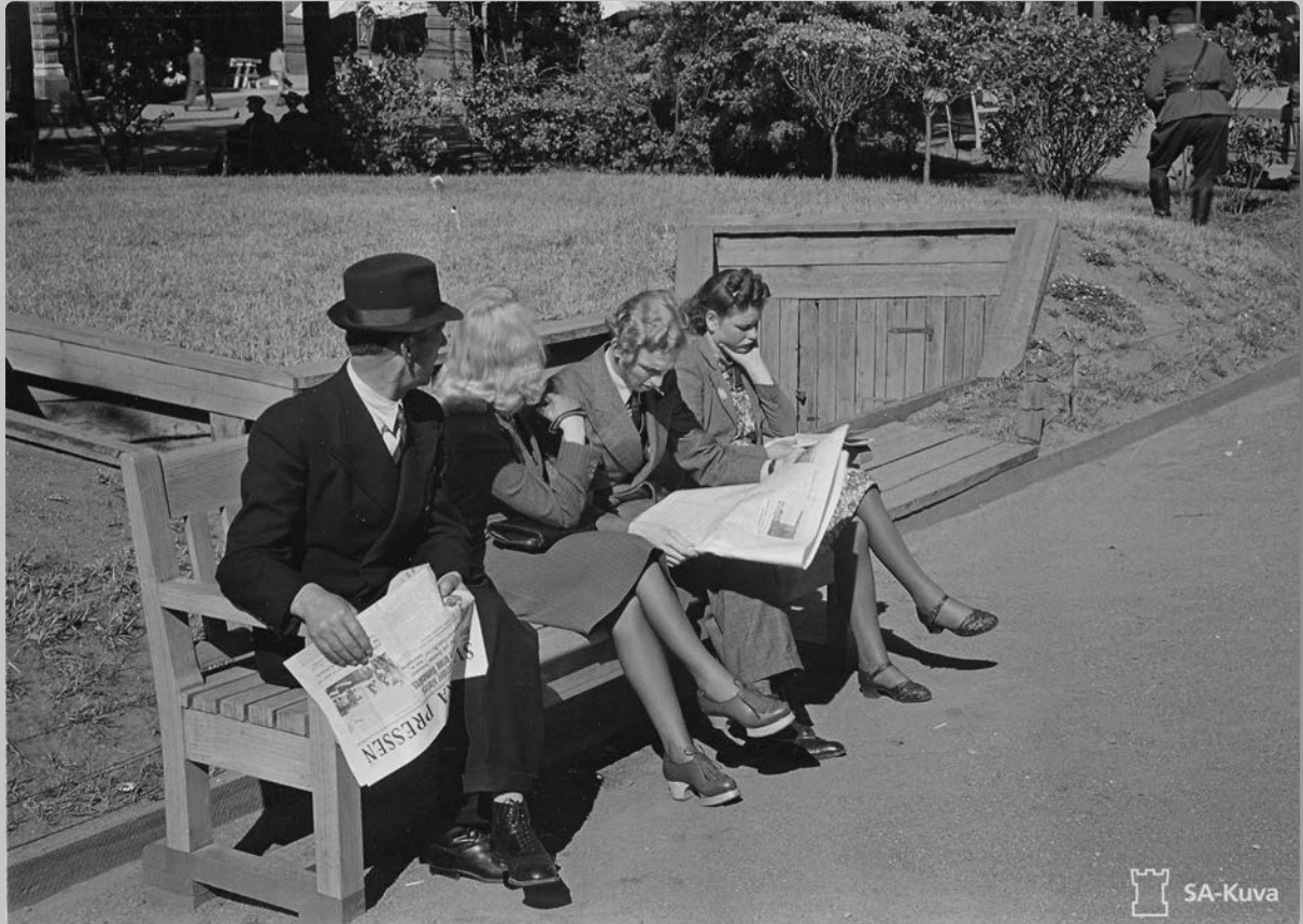
Välirauhan aika oli Suomessa epävarmuuden ja Neuvostoliiton painostuksen aikaa SA-kuva 20098, Kalle Sjöblom, Helsinki.