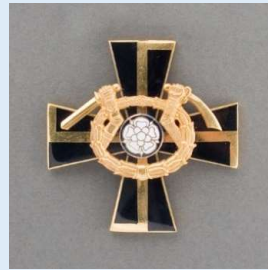
Vapaudenristin 2.lk Mannerheim-risti