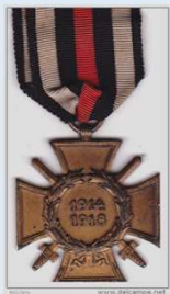
Saksan maailmansodan 1914-1918 kunniaristi