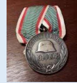
Unkarin Maailmansodan 1914-18 muistomitali