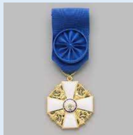
Suomen Valkoisen Ruusun Ritarikunnan 1. lk ritarimerkki