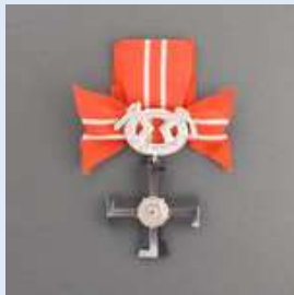
4. lk Vapaudenristi miekkoineen