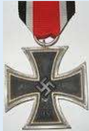
Saksan 2. luokan rautaristi