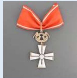
1. lk Vapaudenristi miekkoineen