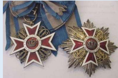
Romanian Kruunuritarikunnan suurristi rintatähden kera