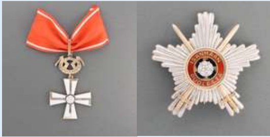
1. lk Vapaudenristi rintatähtineen ja miekkoineen