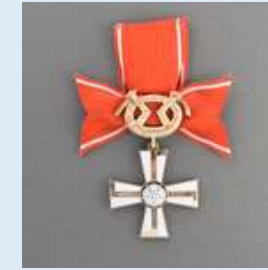
2. lk Vapaudenristi miekkoineen