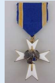
Viron Suojeluskunnan 3. lk Valkoinen risti