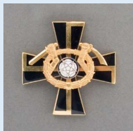
Vapaudenristin 2.lk Mannerheim-risti