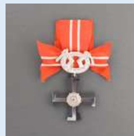
4. lk Vapaudenristi miekkoinen