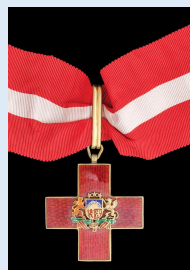
Latvian Punaisen Ristin 1. luokan risti