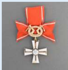
2. lk Vapaudenristi miekkoinen