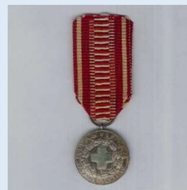
Suomen Punaisen Ristin hopeinen ansiomitali