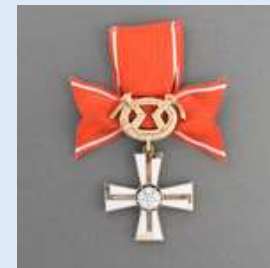
2. lk Vapaudenristi miekkoinen