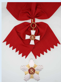
Suomen Leijonan suurristi