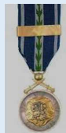
RUL:n kultainen ansiomitali soljen kera