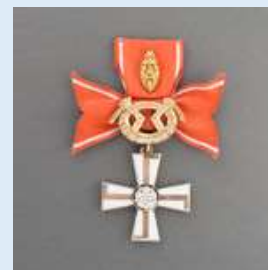
2. lk Vapaudenristi miekkoineen ja tammenlehvineen