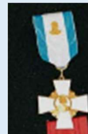
Sotaveteraanien kultainen ansioristi