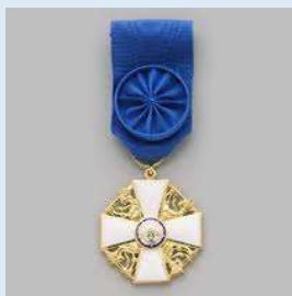
Suomen Valkoisen Ruusun 1. lk ritarimerkki