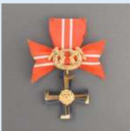
3. lk Vapaudenristi miekkoinen