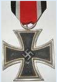
Saksan 2. luokan rautaristi