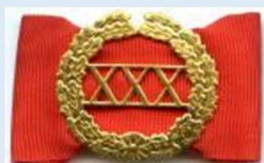
Valtion virka-ansiomerkki 30 v. palveluksesta