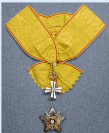
Vapaudenristin Suurristi miekkojen kera