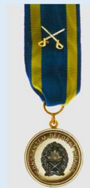
Kadettikunnan ansiomitali miekkojen kera