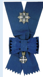
Viron Marianmaan Ristin ritarikunnan suuristi