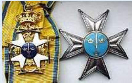
Ruotsin Miekkaritarikunnan suuristin komentaja