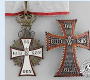
Tanskan Dannebrogin 1lk. komentaja