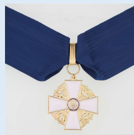
Suomen Valkoisen Ruusun komentajamerkki