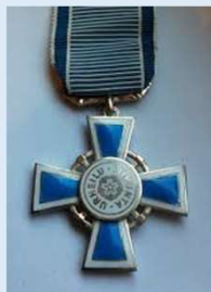
Suomen liikuntakulttuurin ja urheilun hopeinen ansioristi