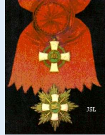
Romanian Tähti-ritarikunnan suurristi rintatähden kera