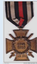
Saksan maailmansodan 1914-1918 kunniaristi