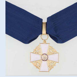
Suomen Valkoisen Ruusun 2. lk komentajamerkki