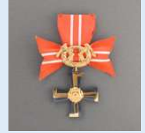
3. lk Vapaudenristi miekkoineen