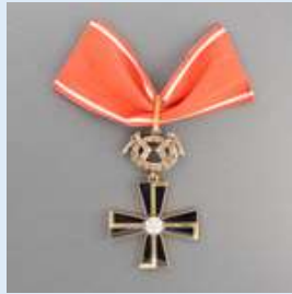
Vapaudenristin 1.lk Mannerheim-risti