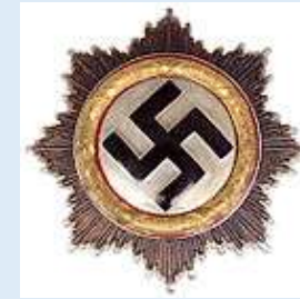
Saksan Ristin ritarikunnan kultainen risti