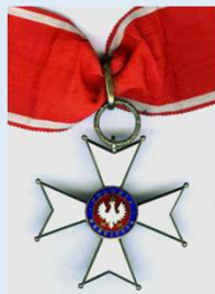
Puolan Polonia Restituta –ritarikunnan komentajaristi rintatähden kera