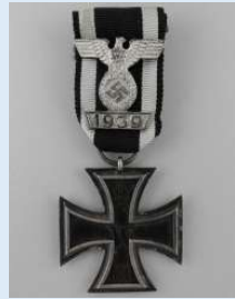
Saksan 2. lk rautaristi soljen kera