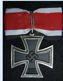
Saksan Rautaristin ritarikunnan ritariristi