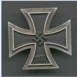
Saksan 1. luokan rautaristi