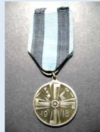
Vapaussodan muistomitali (saatu soljen kera)