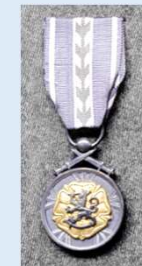
RUL:n kultainen ansiomitali