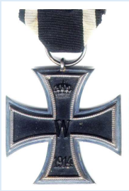
Preussin 2. luokan rautaristi