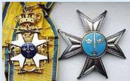
Ruotsin Miekkaritarikunnan Suurristin komentaja