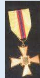
Inkerin Valkoisen Muurin Ansioristi