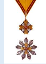
Latvian Kolmen Tähten ritarikunnan 2. lk komentaja = 3. luokka