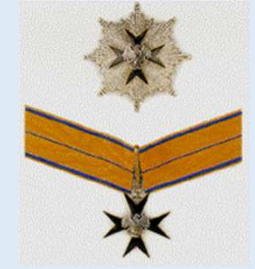
Viron Kotka-ristin 2 luokka