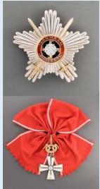
Vapaudenristin Suurristi miekkojen kera