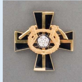
Vapaudenristin 2.lk Mannerheim-risti