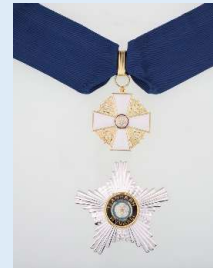
Suomen Valkoisen Ruusun 1. lk. komentajamerkki