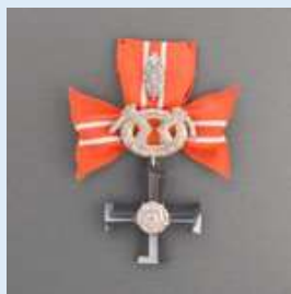
4. lk Vapaudenristi miekkoineen ja tammenlehvineen