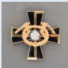
Vapaudenristin 2.lk Mannerheim-risti