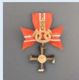
3. lk Vapaudenristi miekkoineen ja tammenlehvineen