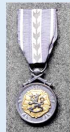
RUL:n kultainen ansiomitali