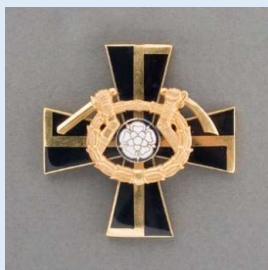
Vapaudenristin 2.lk Mannerheim-risti