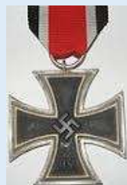
Saksan 2. luokan rautaristi