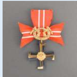
3. lk Vapaudenristi miekkoineen