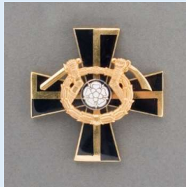
Vapaudenristin 2.lk Mannerheim-risti