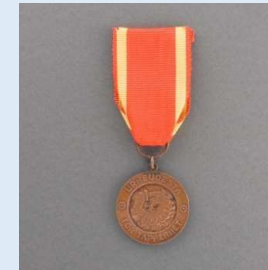
2. lk Vapaudenmitali