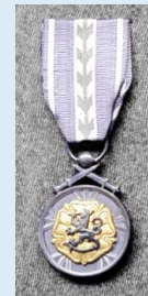
RUL:n kultainen ansiomitali