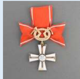
2. lk Vapaudenristi miekkoinen