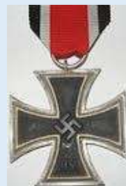
Saksan 2. luokan rautaristi