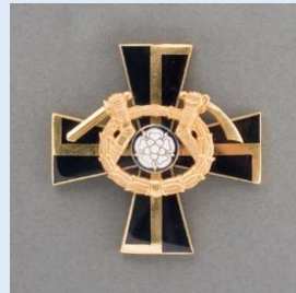
Vapaudenristin 2.lk Mannerheim-risti