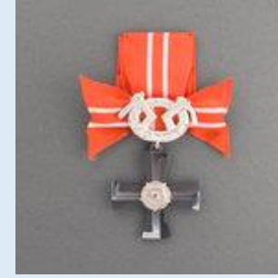
4. lk Vapaudenristi miekkoineen