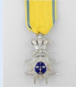
Ruotsin Miekka- ritarikunnan 2. lk risti