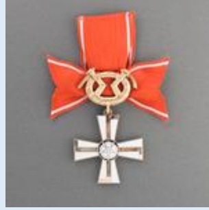
2. lk Vapaudenristi miekkoineen