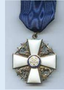
Suomen Valkoisen Ruusun Ritarikunnan ritarimerkki