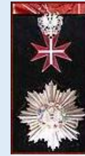
Itävallan ansioritarikunnan suuri hopeinen kunniamerkki rintatähtineen