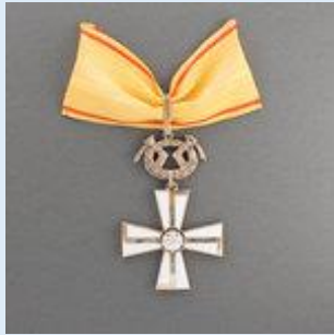
1. lk Vapaudenristi miekkoineen rauhanajan ansioista