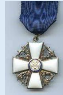
Suomen Valkoisen Ruusun Ritarikunnan ritarimerkki