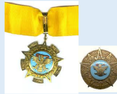
Meksikon Atsteekien Kotkan Ritarikunnan Suurupseeri