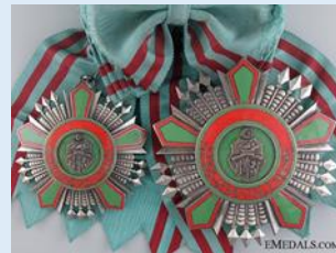
Tunisian tasavallan ritarikunnan suurristi