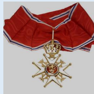
Norjan Pyhän Olavin ritarikunnan 2 lk. komentaja