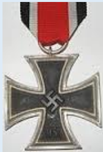
Saksan 2. luokan rautaristi