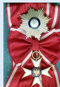
Puolan Polonia Restituta suuristi