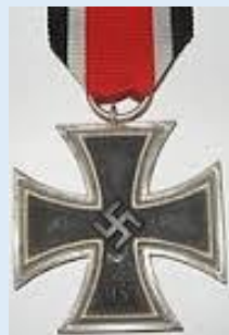
Saksan 2. luokan rautaristi