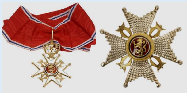
Norjan Pyhän Olavin ritarikunnan 1 lk. komentaja