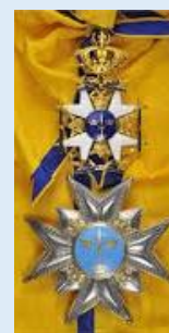
Ruotsin Miekkaritarikunnan suuristin komentaja