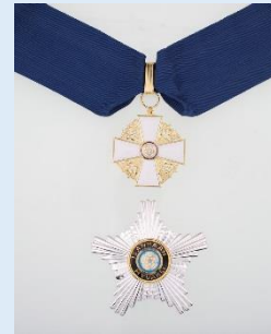
Suomen Valkoisen Ruusun 1. lk. komentajamerkki