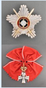
Vapaudenristin Suurristi miekkojen kera