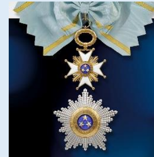
Latvian Kolmen Tähten komentaja 1. luokka (suuristi)