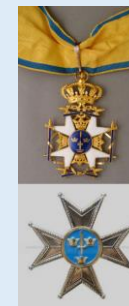
Ruotsin Miekkaritarikunnan 1. lk. komentaja