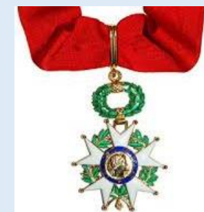
Ranskan kunnialegioonan komentaja