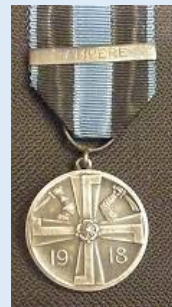
Vapaussodan muistomitali soljen kera