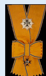
Viron Kotka-ritarikunta 1. luokka