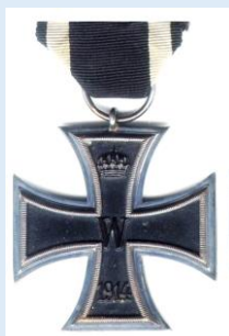
Preussin 2. luokan rautaristi