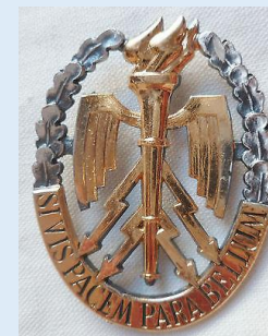
Ranskan Sotakorkeakoulun kurssimerkki Ecole Supérieure de Guerre Si Vis Pacem Para Bellum