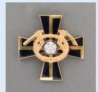
Vapaudenristin 2.lk Mannerheim-risti