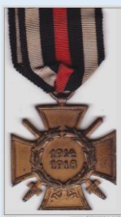
Saksan maailmansodan 1914-1918 kunniaristi