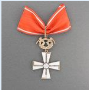
1. lk Vapaudenristi miekkoineen