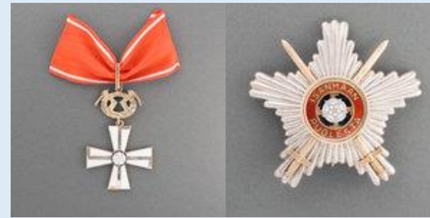
1. lk Vapaudenristi rintatähtineen miekkojen kera