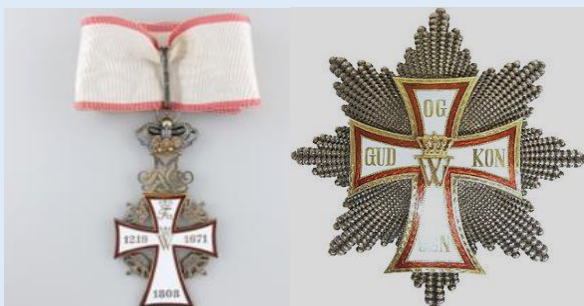
Tanskan Dannebrogin 1lk. komentaja