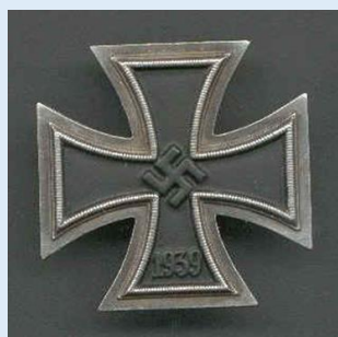
Saksan 1. luokan rautaristi