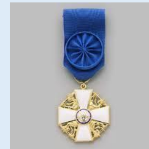
Suomen Valkoisen Ruusun 1. lk ritarimerkki