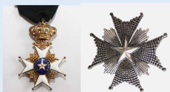
Ruotsin Pohjantähden Ritarikunnan 1. lk komentaja