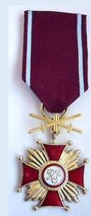
Puolan kultainen ansioristi