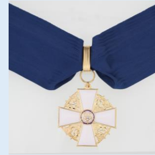
Suomen Valkoisen Ruusun 2. lk komentajamerkki