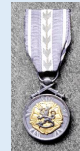
RUL:n kultainen ansiomitali