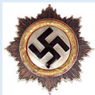
Saksan Ristin ritarikunnan kultainen risti