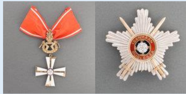
1. lk Vapaudenristi rintatähtineen miekkojen ja tammenlehvän kera