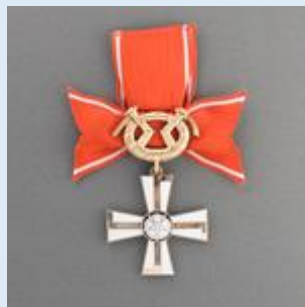
2. lk Vapaudenristi miekkoinen