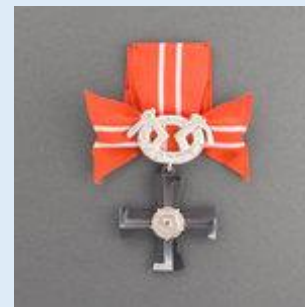
4. lk Vapaudenristi miekkoinen