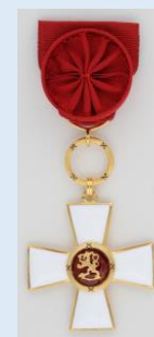
Suomen Leijonan 1 lk. ritarimerkki