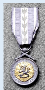
RUL:n kultainen ansiomitali