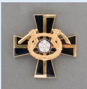
Vapaudenristin 2.lk Mannerheim-risti