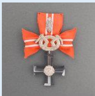
4. lk Vapaudenristi miekkoinen ja tammenlehvineen