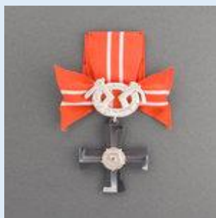
4. lk Vapaudenristi miekkoinen