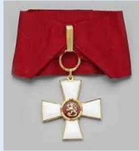
Suomen Leijonan 2 lk. komentaja