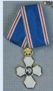
Islannin Haukan Ritari