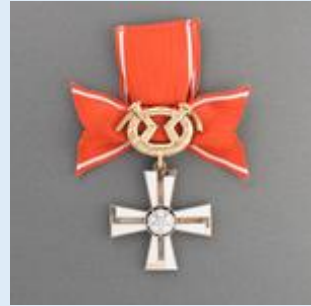
2. lk Vapaudenristi miekkoinen