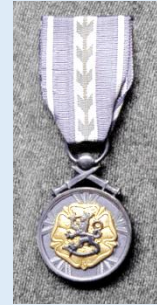
RUL:n kultainen ansiomitali