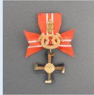
3. lk Vapaudenristi miekkoinen ja tammenlehvineen