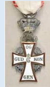
Tanskan Dannebrogin ritarikunnan ritari