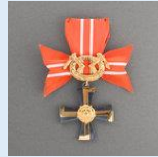
3. lk Vapaudenristi miekkoinen