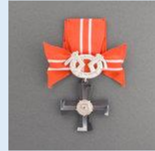
4. lk Vapaudenristi miekkoinen