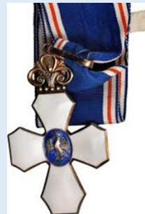
Islannin Haukan komentaja