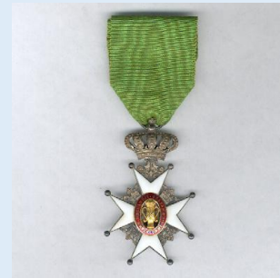
Ruotsin Vasa- ritarikunnan ritari