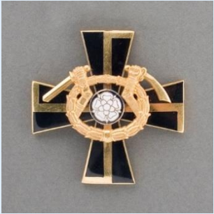
Vapaudenristin 2.lk Mannerheim-risti