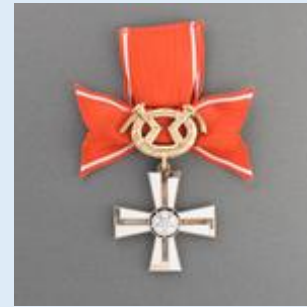
2. lk Vapaudenristi miekkoineen