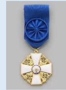
Suomen Valkoisen Ruusun Ritarikunnan 1. lk ritarimerkki