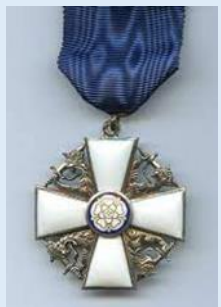
Suomen Valkoisen Ruusun Ritarikunnan 2. lk ritarimerkki