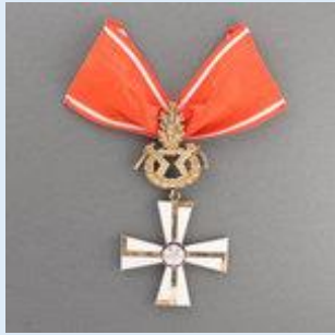
1. lk Vapaudenristi miekkoineen ja tammenlehvineen