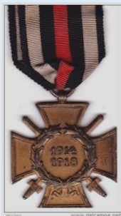
Saksan maailmansodan 1914-1918 kunniaristi