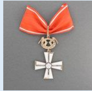
1. lk Vapaudenristi miekkoineen