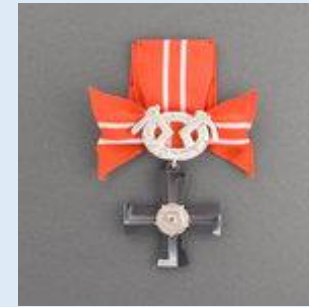
4. lkn Vapaudenristi miekkoineen