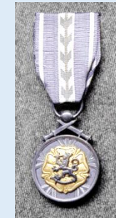
RUL:n kultainen ansiomitali