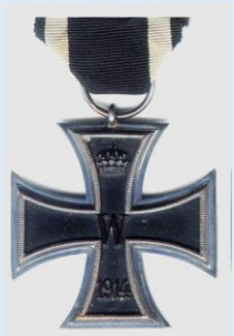
Preussin 2. luokan rautaristi