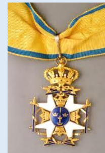
Ruotsin Miekkaritarikunnan 1 lk. komentaja