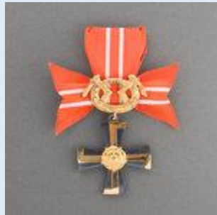
3. lk Vapaudenristi miekkoinen