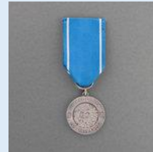
1. lk Vapaudenmitali