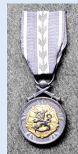
RUL:n kultainen ansiomitali