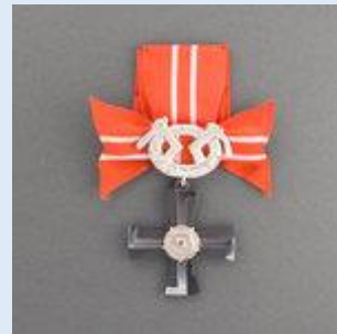
4. lk Vapaudenristi miekkoinen