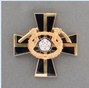
Vapaudenristin 2.lk Mannerheim-risti