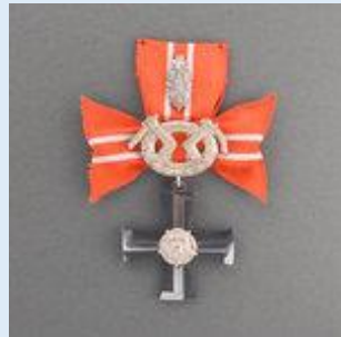
4. lk Vapaudenristi miekkoinen ja tammenlehvineen