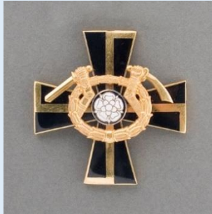
Vapaudenristin 2.lk Mannerheim-risti