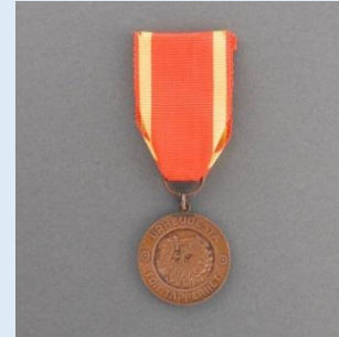
2. lk Vapaudenmitali