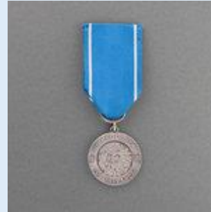
1. lk Vapaudenmitali