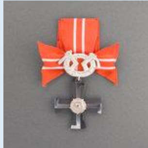
4. lk Vapaudenristi miekkoineen