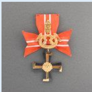
3. lk Vapaudenristi miekkoineen ja tammenlehvineen