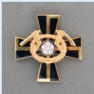
Vapaudenristin 2.lk Mannerheim-risti