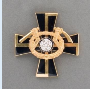
Vapaudenristin 2.lk Mannerheim-risti