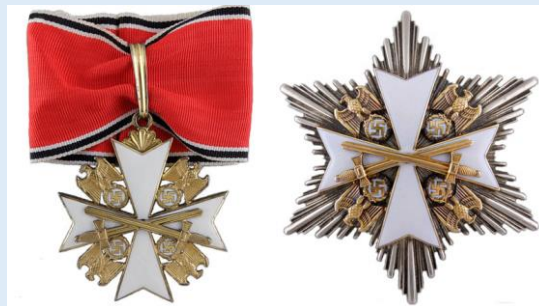
Saksan Kotkan 2 lk. ansioristi