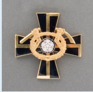
Vapaudenristin 2.lk Mannerheim-risti