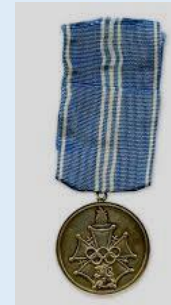
Suomen olympialainen ansiomitali