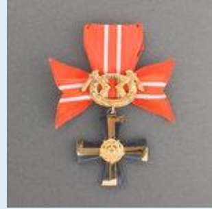
3. lk Vapaudenristi miekkoineen