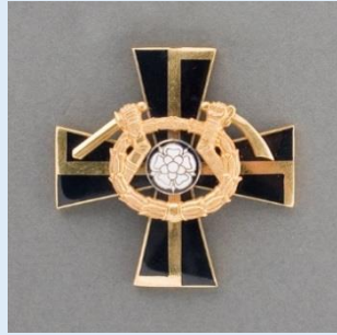
Vapaudenristin 2.lk Mannerheim-risti