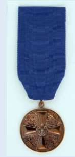
Suomen Valkoisen Ruusun 2 lk. mitali