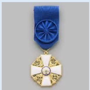
Suomen Valkoisen Ruusun 1. lk ritarimerkki