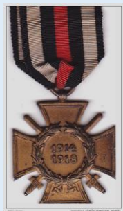
Saksan maailmansodan 1914-1918 kunniaristi