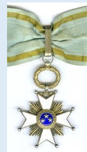
Latvian Kolmen Tähten komentaja