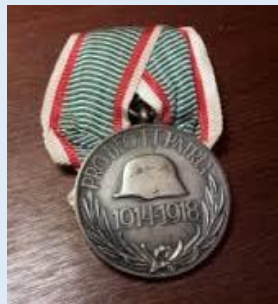
Unkarin Maailmansodan 1914-18 muistomitali