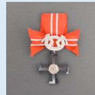
4. lk Vapaudenristi miekkoinen