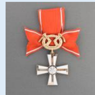
2. lk Vapaudenristi miekkoinen