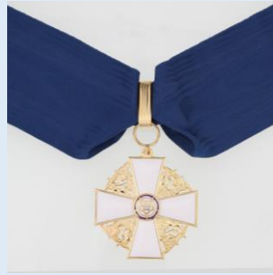
Suomen Valkoisen Ruusun 2. lk komentajamerkki