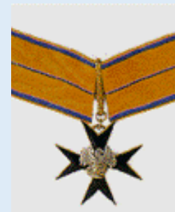
Viron Kotka-ristin 3. luokka