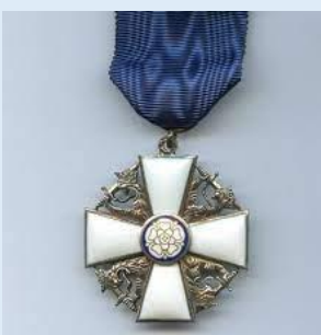
Suomen Valkoisen Ruusun 2. lk ritarimerkki