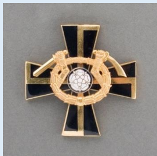
Vapaudenristin 2.lk Mannerheim-risti