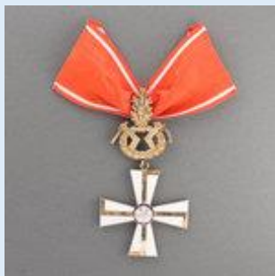
1. lk Vapaudenristi miekkoinen ja tammenlehvineen