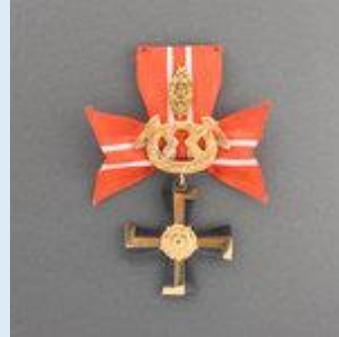
3. lk Vapaudenristi miekkoineen ja tammenlehvineen