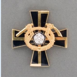
Vapaudenristin 2.lk Mannerheim-risti