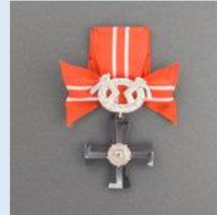
4. lk Vapaudenristi miekkoineen