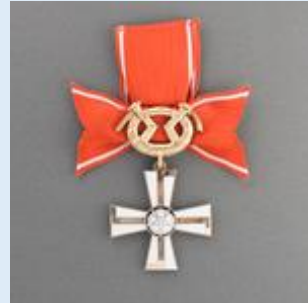
2. lk Vapaudenristi miekkoineen