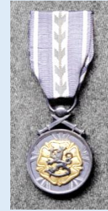
RUL:n kultainen ansiomitali