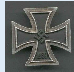
Saksan 1. luokan rautaristi