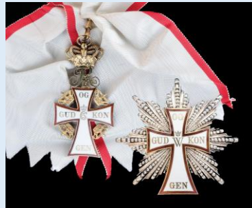
Tanskan Dannebrogin suurristi