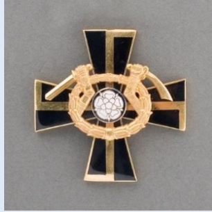
Vapaudenristin 2.lk Mannerheim-risti