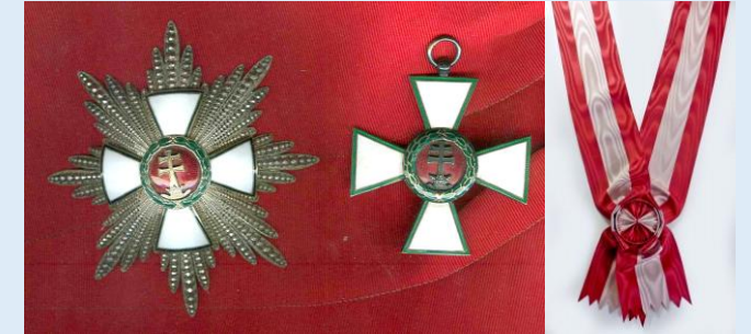
Unkarin Ansioritarikunnan suurristi