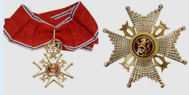
Norjan Pyhän Olavin ritarikunnan 1 lk. komentaja