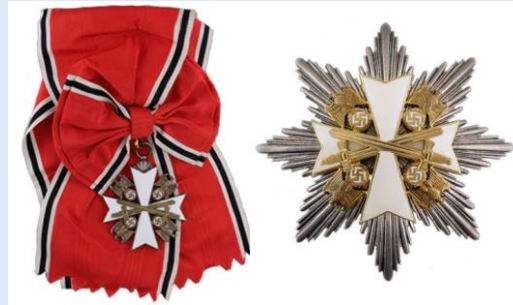
Saksan Kotkan suurristi miekkojen kera