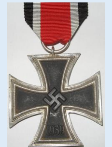
Saksan 2. luokan rautaristi