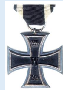
Preussin 2. luokan rautaristi