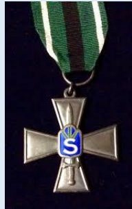
Suojeluskuntain hopeinen ansioristi