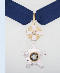
Suomen Valkoisen Ruusun 1. lk. komentajamerkki