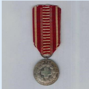
Suomen Punaisen Ristin hopeinen ansiomitali