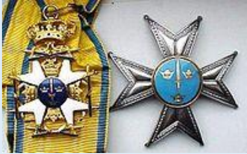
Ruotsin Miekkaritarikunnan suuristin komentaja