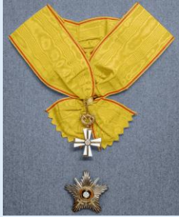
Vapaudenristin suurristi miekkojen kera