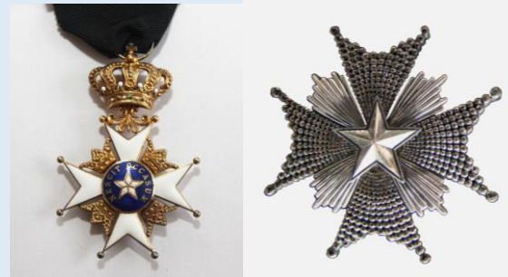
Ruotsin Pohjantähden Ritarikunnan 1. lk komentaja