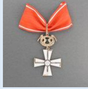
1. lk Vapaudenristi miekkoineen