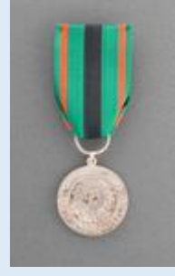
Vapaudenristin 1. lk ansiomitali