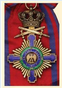
Romanian Tähti- ritarikunnan suurristi