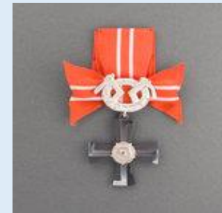
4. lk Vapaudenristi miekkoinen