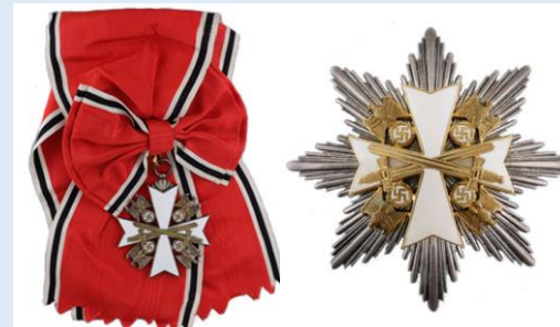
Saksan Kotkan Ritarikunta 1. luokka