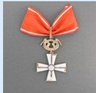
1. lk Vapaudenristi miekkoinen