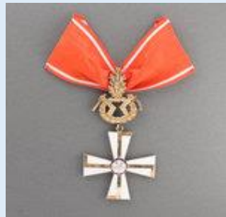
1. lk Vapaudenristi miekkoinen ja tammenlehvineen