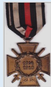
Saksan maailmansodan 1914-1918 kunniaristi