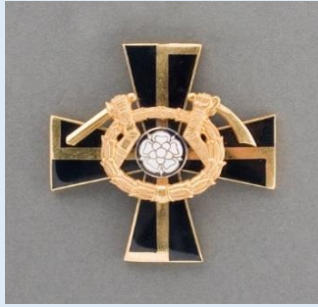
Vapaudenristin 2. lk Mannerheim-risti