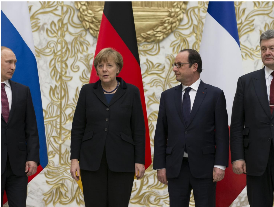
Minsk, February 2015