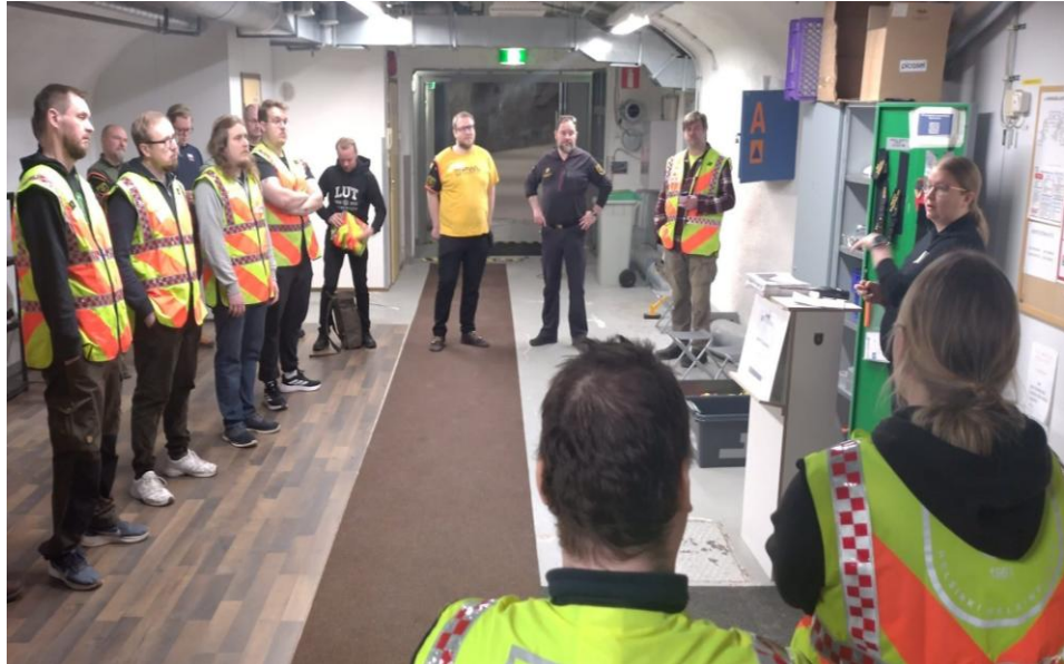
Kurssin loppupuhuttelu.

Jos haluat kalliosuojatehtäviin Espoossa, Kauniaisissa tai Vantaalla, kannattaa ottaa yhteyttä kyseisen kaupungin hallintoon tai yhteiskäyttösuojien hallintoon.