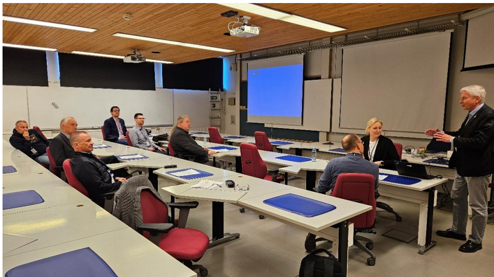
Vastauksia pohditaan pahenevaan häiriötilanteeseen logistiikan työryhmässä.

SrUK tukee näitä kursseja ja kerhon edustajia oli tällä kurssilla sekä järjestelyryhmässä että työryhmiä ohjaamassa. Me olimme kurssilla osallistujina Senioriupseerien kerholle varatuilla oppilaspaikeilla. Näiden kurssijärjestelyjen lisäksi kerhon eräs toimintasuunta on tarkoitus kehittää yksilön varautumista, joka on saanut viralliseksi nimekseen kansalaisen varautuminen. Mikä tarkoittaa sitä mitä jokainen voi tehdä omalle itselleen, lähipiirissä, asuintalossa ja -paikassa, työssä, harrastuksissa jne. Eli tarkastellaan asiaa laajemmin kuin kotivara. Meillä on kerhossa noin 500 jäsentä ja jokainen kuuluu lisäksi peruskerhoonsa, joissa on yhteensä n. 5000 jäsentä. Jos saamme osan tästä joukosta parantamaan varautumista, on sillä jo merkitystä.