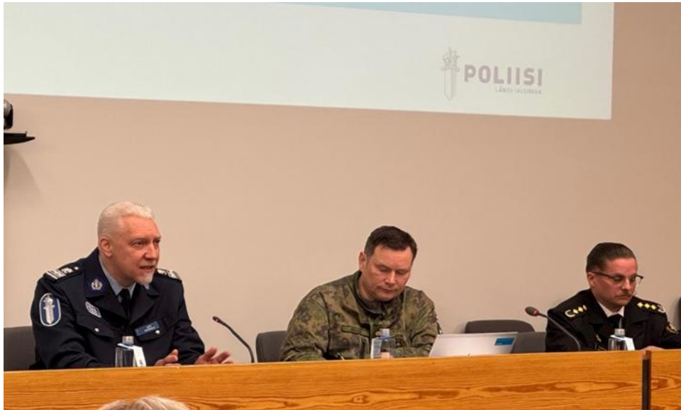
Turvallisuuden edustajat paneelikeskustelussa.

harjoiteltu yhteistyö. Erityisesti lainsäädännön, kuten valmiuslain, sekä ihmisten henkisen kriinkestävyyden ymmärtäminen nousivat teknisen infrastruktuurin ja fyysisen turvallisuuden rinnalle keskeisiksi teemoiksi.