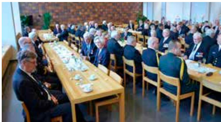
Eero Joutsikosken juhlapuhe ei ollut kuivakka tai väritön.