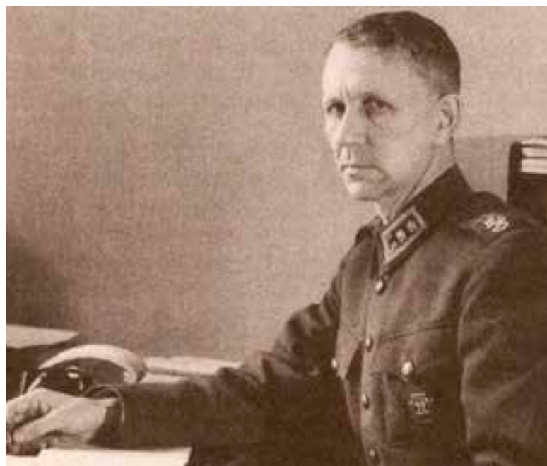
Kenraaliluutnantti Harald Öhquist, II AK:n komentaja

Vastahyökkäystä suunnitellaan, mutta Österman ei näe sen menestymismahdollisuutta. Itsenäisyyspäivä on painumassa iltaan Karjalan Kannaksella 1939.