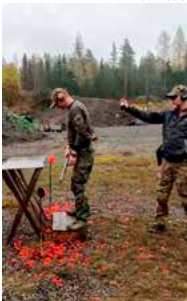
Pistoolirastilla kiekko "dronet" piti tuhota ennen ampumasuoritusta.

Syyskilpailu sisälsi 6 rastia, joissa ammuttiin pistoolilla, kiväärillä, sekä haulikolla. Rastit sisälsivät mukavan monimuotoista suunnittelua, haastavaa liikkumista kiväärillä CQB-olosuhteissa, liikkeellelähtöä istuen ja pistooli pöydällä, ovien ja luukkujen avaa-