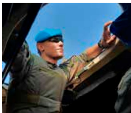
Rotaatiokoulutukseen kouluttajat valitaan vapaaehtoisuuden ja sopivuuden perusteella.

KRIHA-pooliin pääsyn edellytyksenä on hyvin suoritettu KRIHA-palvelus (tai vastaava) sekä MPK:n kouluttajakurssin (K1) suorittaminen. Kouluttajakurssija järjestetään ympäri Suomea ja ne löytyvät MPK:n koulutuskalenterista ( https://koulutuskalenteri.mpk.fi/Koulutuskalenteri ), jota kautta voi myös ilmoittautua kurseille. Seuraavia kurssija järjestetään esimerkiksi Kajaanissa 20.-22.1.2023 ja Säkylässä 28.-29.1.2023. Erityisesti KRIHA:aan