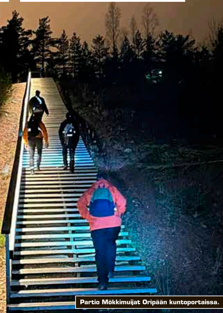
Partio Mökkimujjat Oripään kuntoportaisissa.