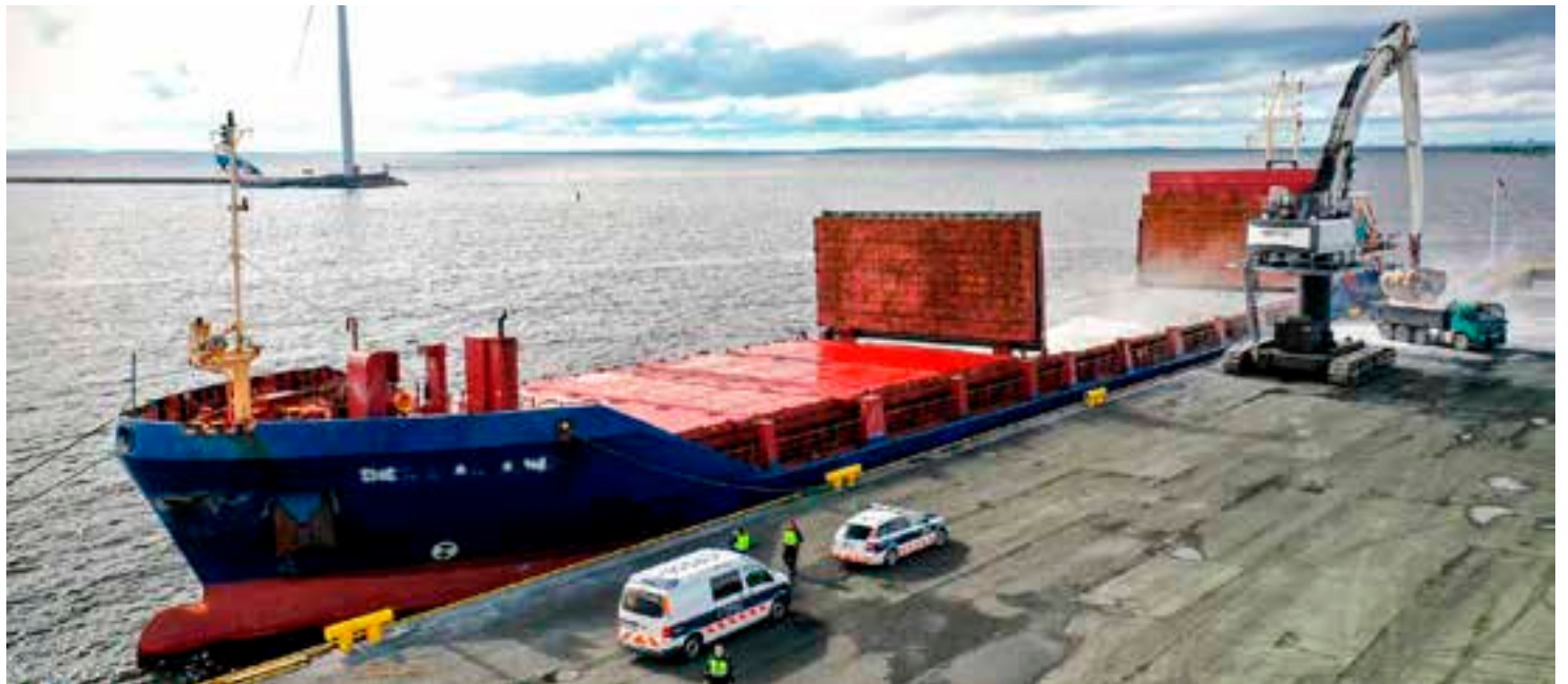
Tullin päätehtäviä on torjua Suomeen ulkomailta kohdistuvaa salakuljetusrikollisuutta.

Varsinais-Suomessa Tullilla on toimipaikka Turussa Pansiontiellä. Turun-toimipaikassa työskentelee tullilaisia muun muassa rikostutkinnassa, liikkuvassa valvontaryhmässä, analyysi- ja tiedusteluosastossa, ulkomaankauppa- ja verotusyksikössä sekä sähköisessä palvelukeskuksessa. Rikostutkinnan vastuulla on tullirikosten estäminen, paljastaminen ja selvittäminen Varsinais-