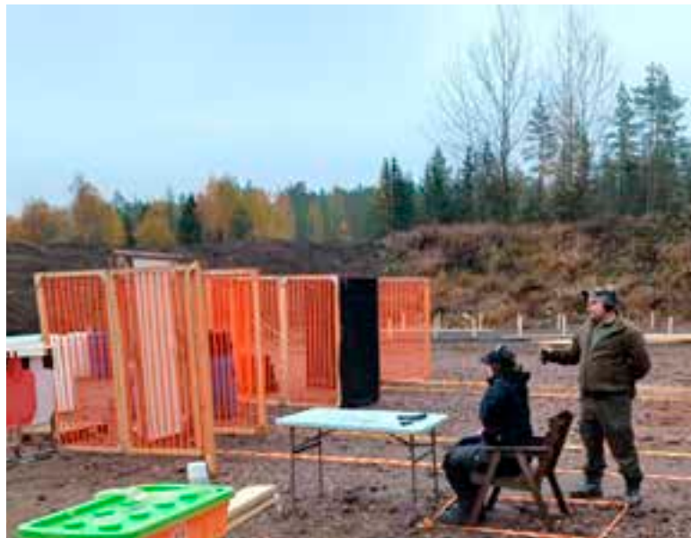
Lähtöasento istuen, pistooli ja lipas pöydällä.