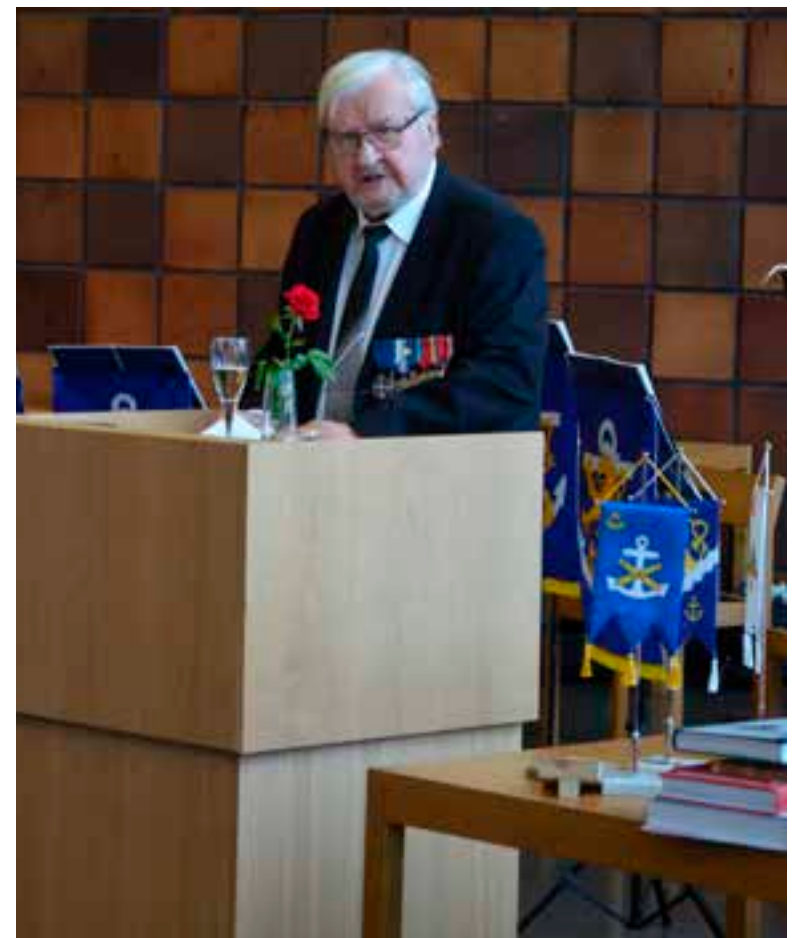
Eero Joutsikosken juhlapuhe ei ollut kuivakka tai väritön.