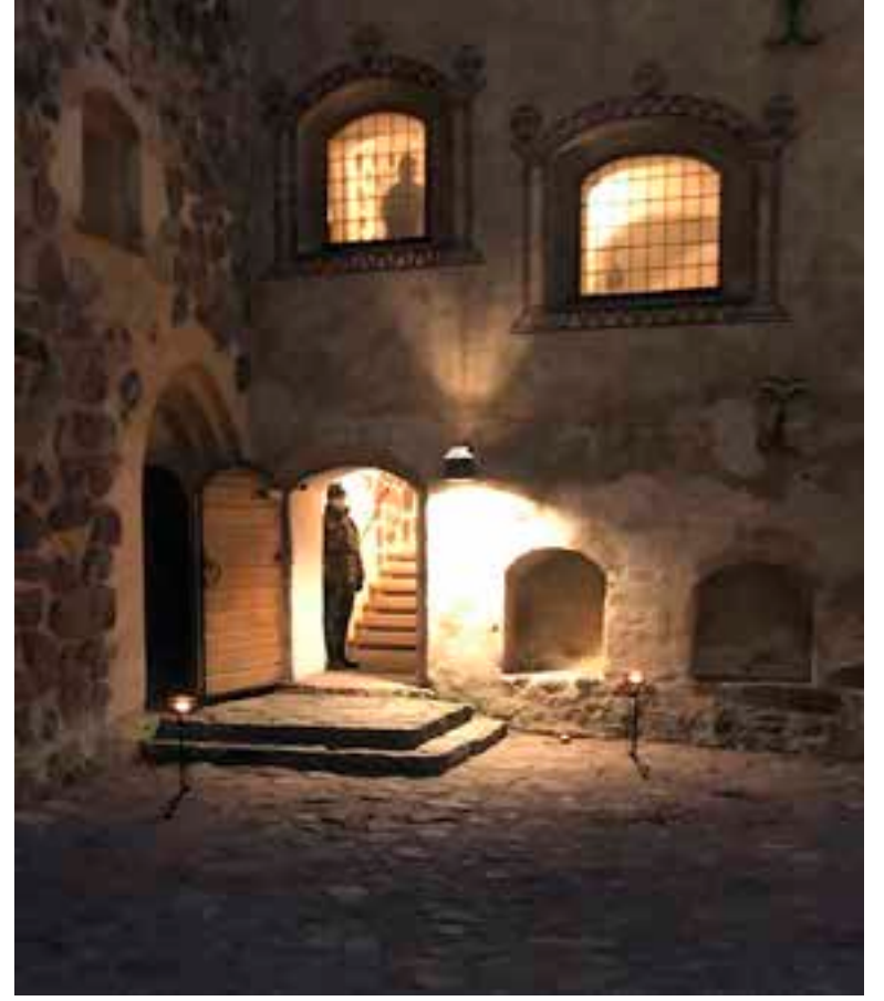
Turun linna on Suomen ensimmäinen varuskunta ja mitä juhlallisina paikoina maanpuolustuksellisille tilaisuuksille.

Viimeisten tutkimusten mukaan yli 80 % kansalaisista haluaa, että Suomea puolustetaan aseellisesti, mikäli maahamme hyökätään. Tämä maanpuolustustahdon ilmaisu on historiallisen korkea ja osoittaa kansalaisten tukea maamme puolustusratkaisuille. Pelkästään