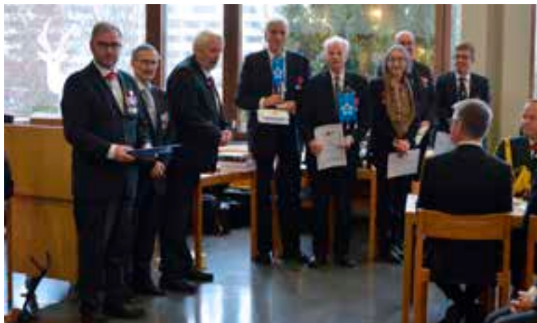
Juhlissa palkittiin ansioituneita kiltalaisia.