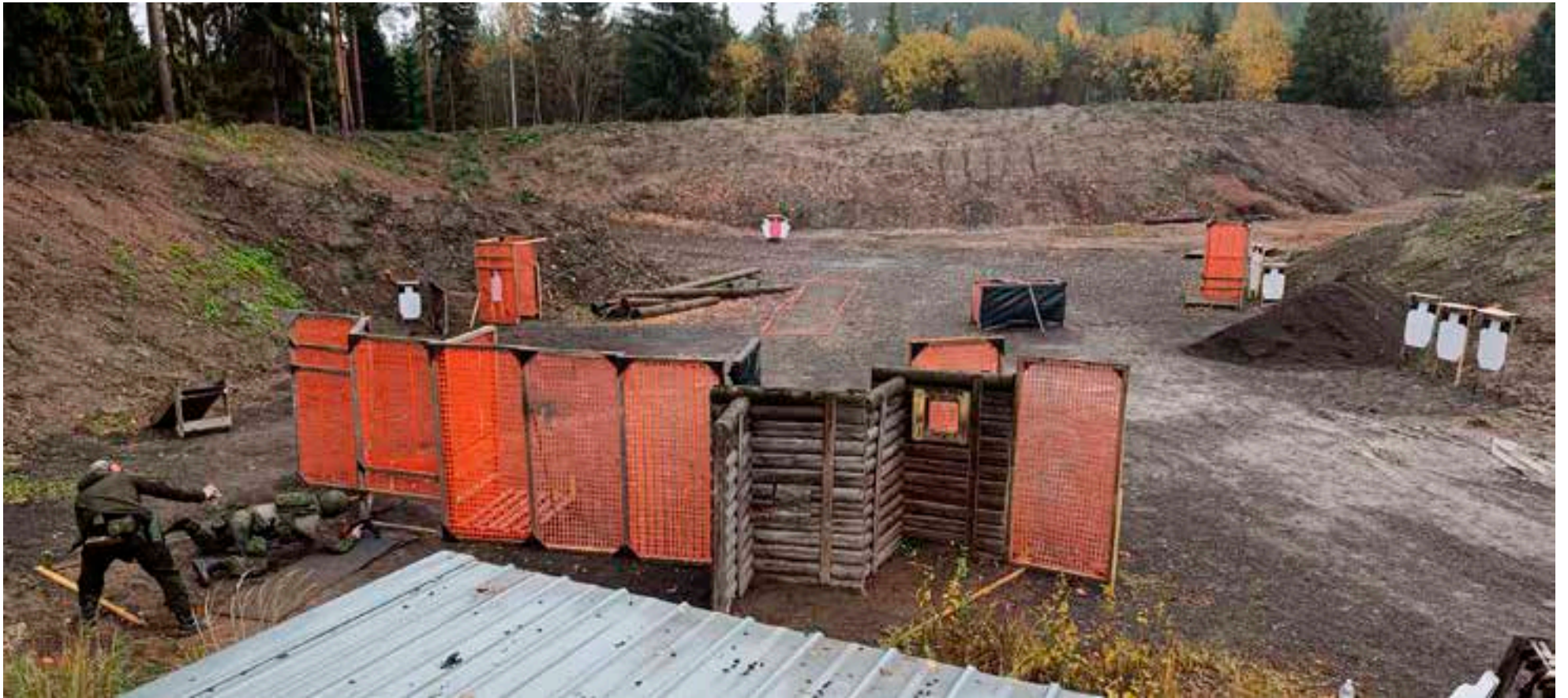
Pitkä yhdistelmästä vaati myös notkeutta.