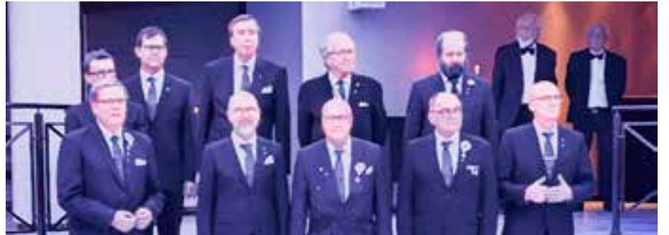
Mieskuoro Laulun Ystävät kohotti tunnelmaa.