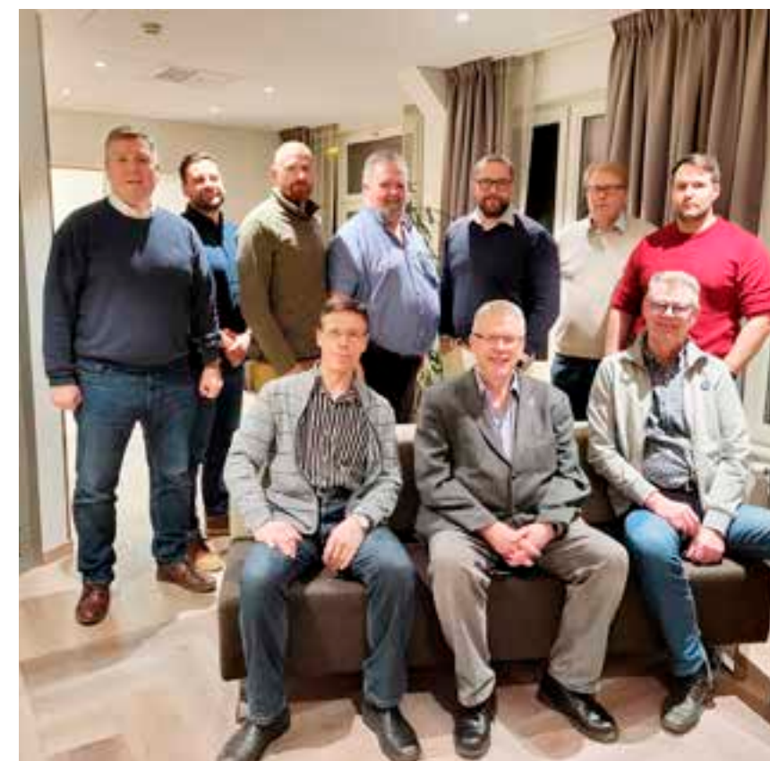
Reserviläispiiriin ja Ahvenanmaan reserviläisten aktiivit tapasivat iloisissa merkeissä.

Piiri toivottaa uudet yhdistykset tervetulleiksi kasvavaan varsinaissuomalaisen reserviläisten joukkoon ja toivottaa aktiivista yhdessäoloa vapaaehtoisen maanpuolustuksen parissa.