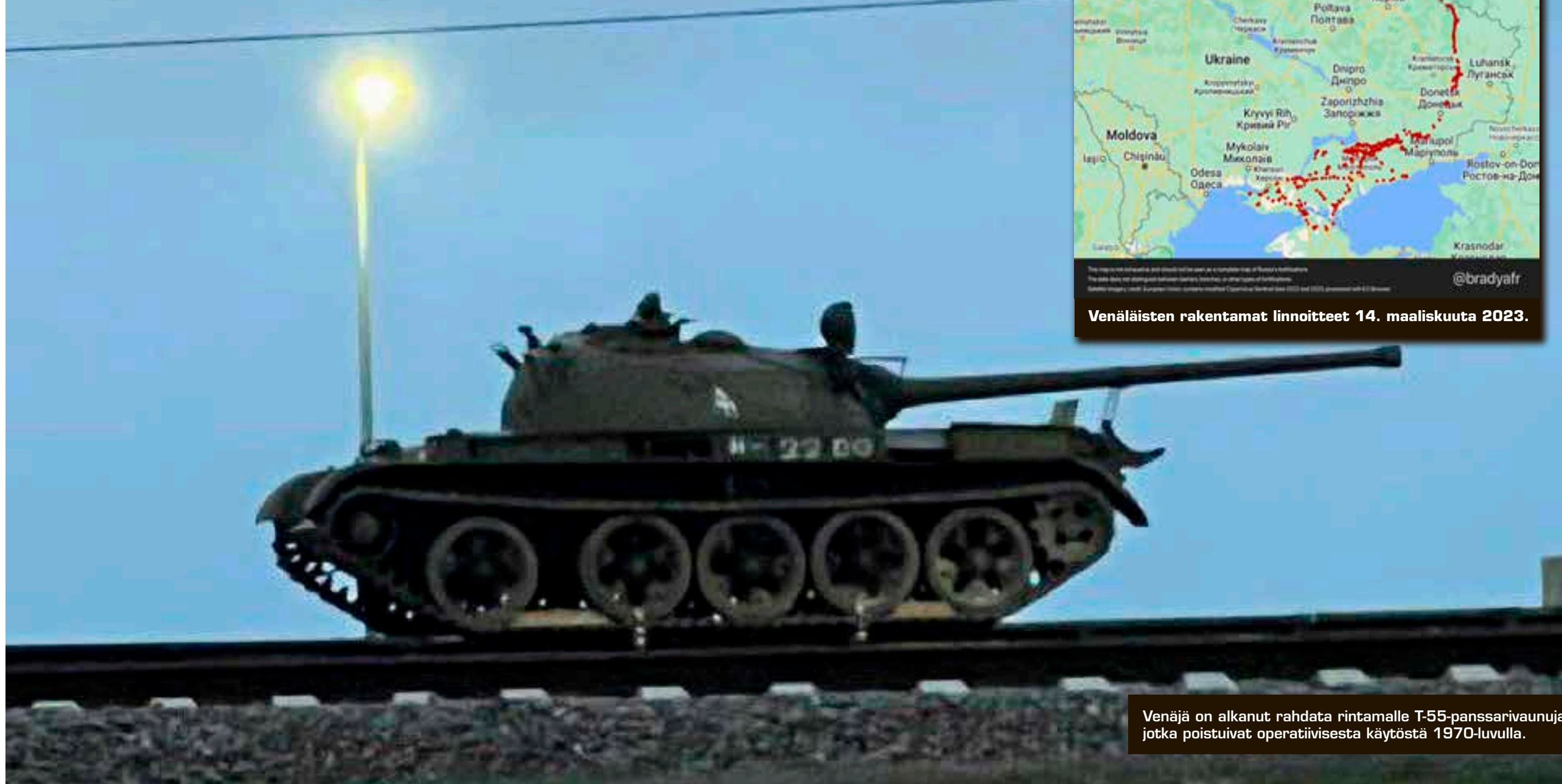
Venäjä on alkanut rahdita rintamalle T-55-panssarivaunuja, jotka poistuivat operatiivisesta käytöstä 1970-luvulla.

Ukraina on muodostamassa kolmea uutta armeijakuntaa ja se on vahvistamassa muita taistelu- ja tukijoukkoja. Näiden joukkojen koulutuksen loppuun saattaminen, suorituskyky ja sijainti vaikuttavat hyökkäyksen ajoitukseen. Toinen tekijä on uuden materiaalin ja sotatarvikkeiden saaminen käyttöön. Ukrainalle on toimitettu ja toimitetaan edelleen taisteluaajoneuvoja, panssarivaunuja, tykistöä, ampumatarvikkeita ja lennokkeja sekä linnoitteiden murtamisessa elintärkeitä pioneerijoukkoja ja raivauskalustoa. Jotta uudesta materiaalista saadaan täysi hyöty, on henkilö- ja koulutettava niiden käyttöön ja tämä vie aikaa viikoista jopa kuukausiin.