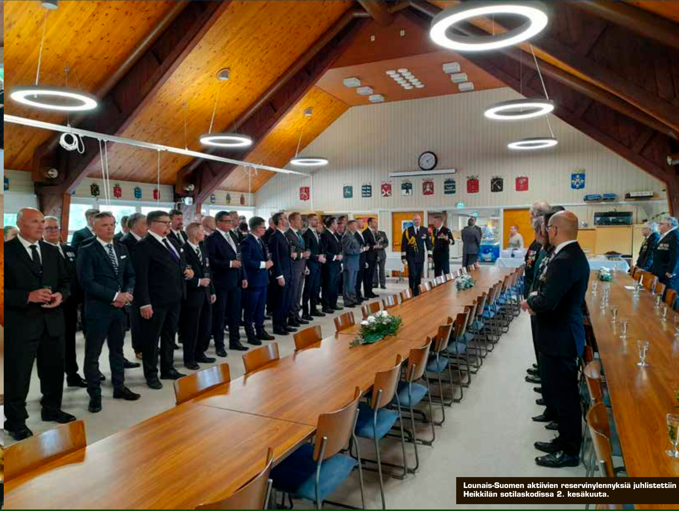
Lounais-Suomen aktiivien reservinylennyksiä juhlistettiin Heikkilän sotilaskodissa 2. kesäkuuta.